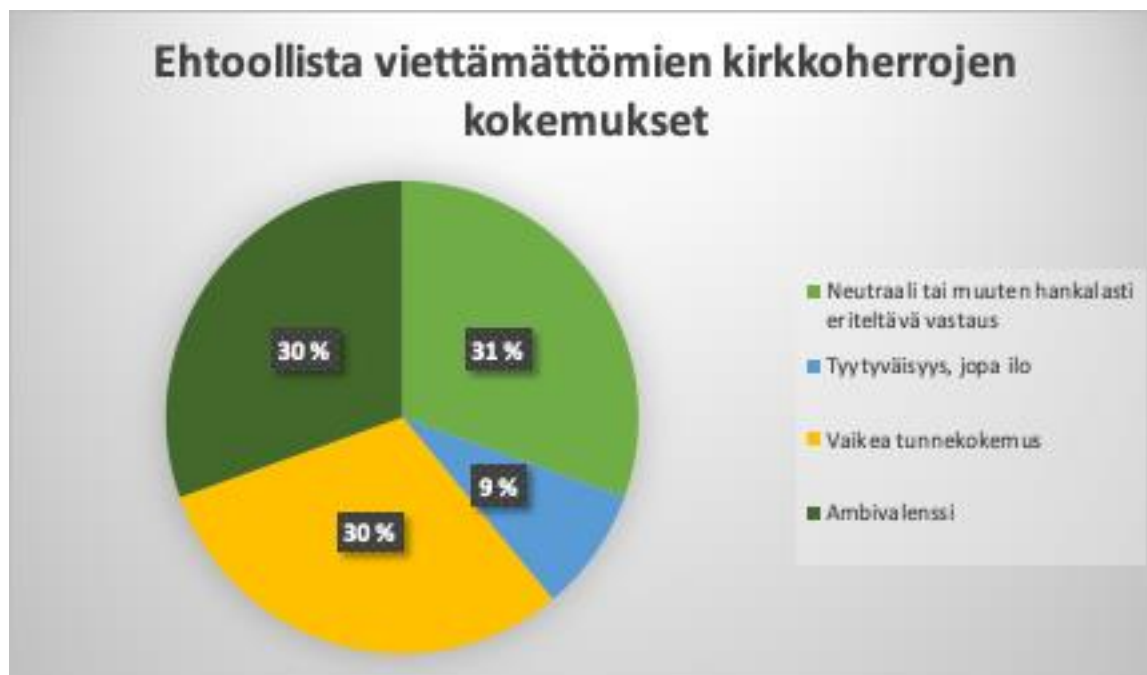
Kuvio 4: Kirkkoherrojen, jotka eivät viettäneet ehtoollista, kokemukset pääsiäisaikana 2020.

Kolmannes (33 %) kysymykseen vastanneista kirkkoherroista kirjoitti vastauksessaan kaipauksesta. Käytettyjä sanamuotoja olivat esimerkiksi yhteyden kaipuu, haikeus, yhteinen kaipaus ja jaettu kaipaus.