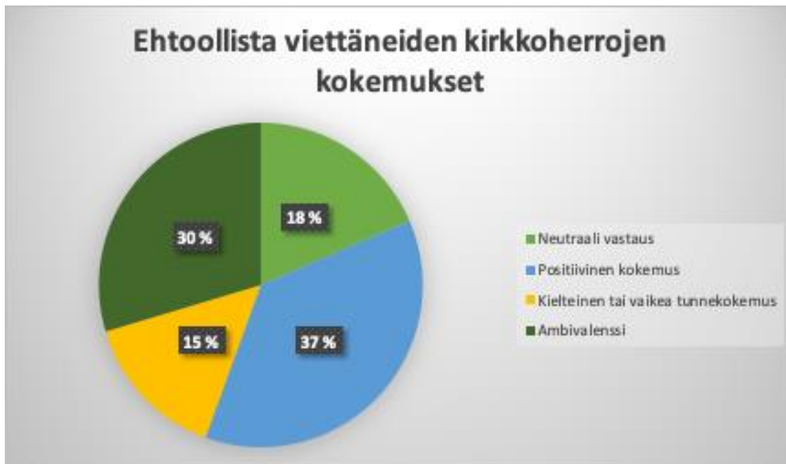
Kuvio 3: Ehtoollista viettäneiden kirkkoherrojen kokemukset.

Ehtoollisjumalanpalveluksen viettäminen pääsiäisaikana nosti kirkkoherroissa esiin hyvin monenlaisia tunteita ja ajatuksia, ja he kuvailivat tuntemuksiaan toisiinsa nähden varsin varioivasti. Lähes 40 prosenttia kysymykseen vastanneista, ehtoollista viettäneistä kirkkoherroista kuvasi kokemusta hyväksi. Neutraalissa sävyssä asiaa kommentoi 18 prosenttia ja kokeemusta tavalla tai toisella kielteiseksi kuvasi noin 15 prosenttia vastanneista. Noin kolmannes ehtoollisjumalanpalveluksen järjestäneistä tai siihen osallistuneista kirkkoherroista ilmaisi vastauksessaan jonkinasteista ristiriitaa asian äärellä. Kuviossa 3 näkyvät ehtoollista pääsiäisaikana 2020 viettäneiden kirkkoherrojen kokemusten prosenttijakaumat.