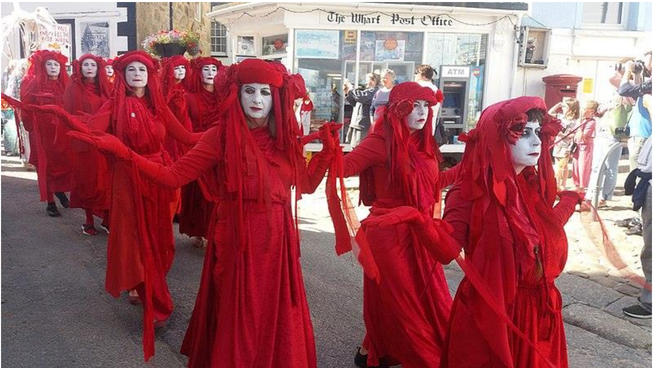
( https://www.youtube.com/watch?v=p4Gry0WKVbw, katsottu 29.1.2021)

Ryhmä ihmisiä on verhoutunut voimakkaan punaisiin kaapuihin ja maalannut kasvonsa valkoisiksi. He liikkuvat julkisessa kaupunkitilassa ja laulavat surulaulua sukupuuttoon kuolleiden lajien vuoksi. 1