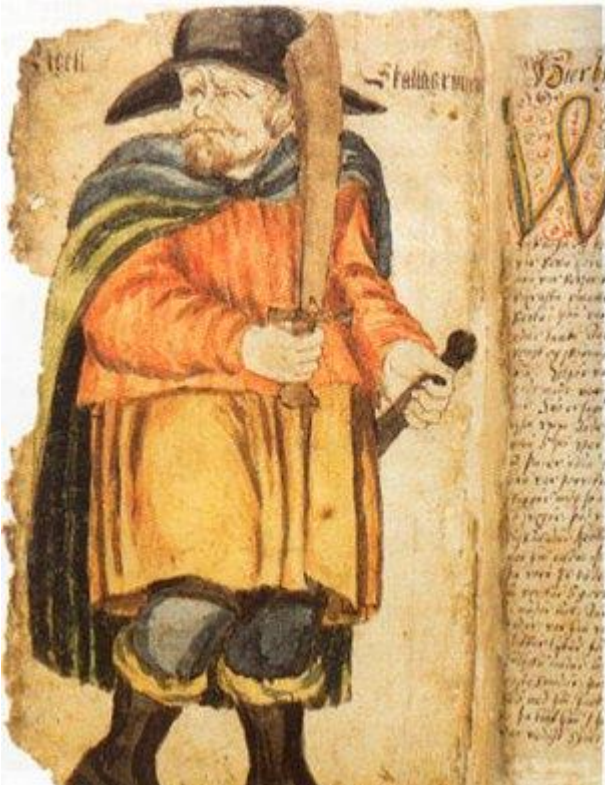
Egil Kalju-Grimminpoika (Egil Skalla-Grímsson) kuvattuna 1600-luvun islantilaisessa käsikirjoituksessa. Egilin kerrottiin saavan raivokohtauksia ja muuttavansa muotoa niiden aikana. Hänet on tutkimuksessa yhdistetty berserkkeihin, vaikka Egil Kalju-Grimminpojan saaga ei mainitse hänen olevan berserkki.