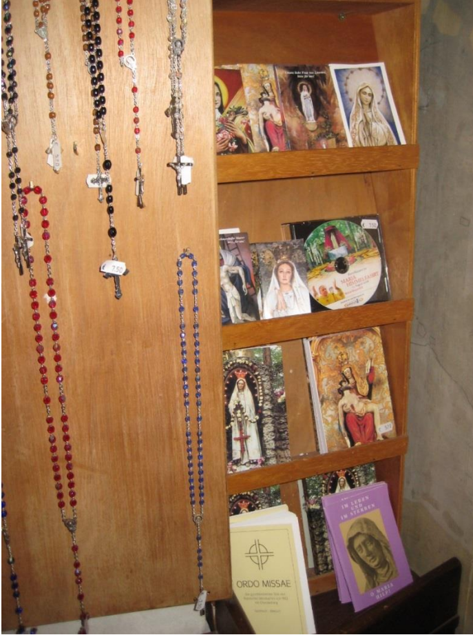
Kuva 6: Patsaan läheisyydessä olevassa kirkossa myytiin kuvia patsaasta sekä muuta kristillistä esineistöä. Ei kuitenkaan samanlaista kasvokuvaa, jonka Michael oli saanut ja myöhemmin ostanut. (IR, 1.1.09)

Kuva sekä varastoi että luovuttaa energiaa, sillä on oma tahto. Kuva on tilanteesta riippuen sekä välitys että kääntäjä: voimaesineenä kuva on kääntäjä, mutta kuvallisena esityksenä välitys. Kuvan merkitys ei vähene, päinvastoin, siitä tulee erityinen ja suojeltava, sillä kuva määrittää Valo-objektia.