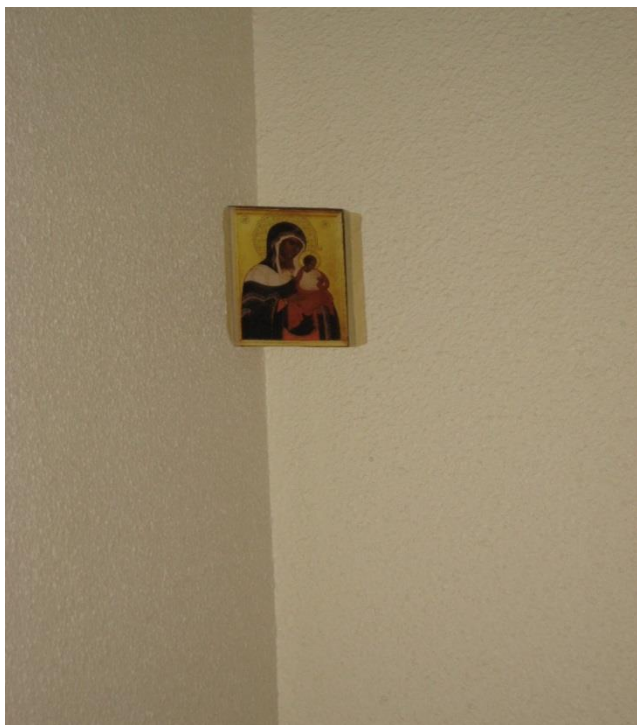
Kuva 9: Ortodoksiosallistujien retriittitilaan tuoma Konevitsan Jumalanäidin ikoni. (IR, 30.3.09)

liturgian osa siinä pöydällä ollessaan. (30.3.09)