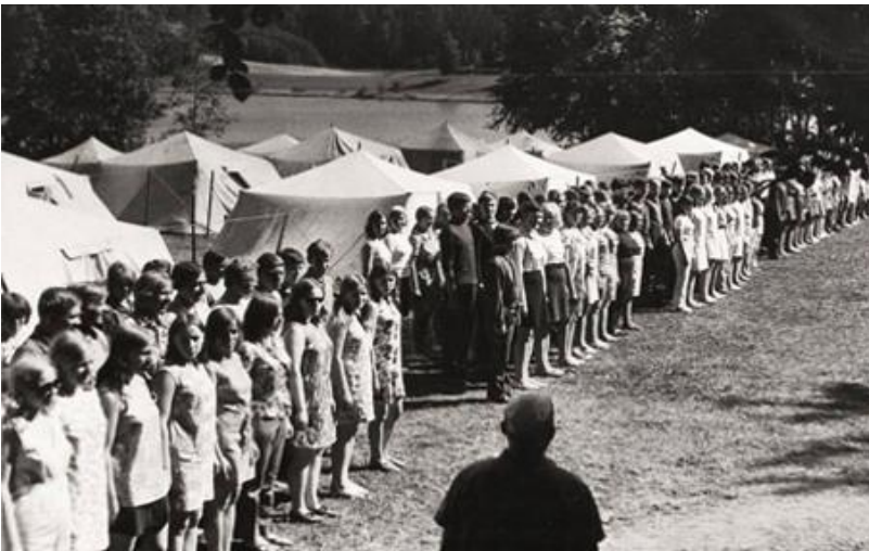
Kuva 4: Nuorten kesäpäivien telttaleiri Võrussa. Kuva julkaistu omistajan luvalla.

tekevät neuvostokansalaiset olivat neuvostoideologian tukipilari. (Remmel 2008, 258–259.)