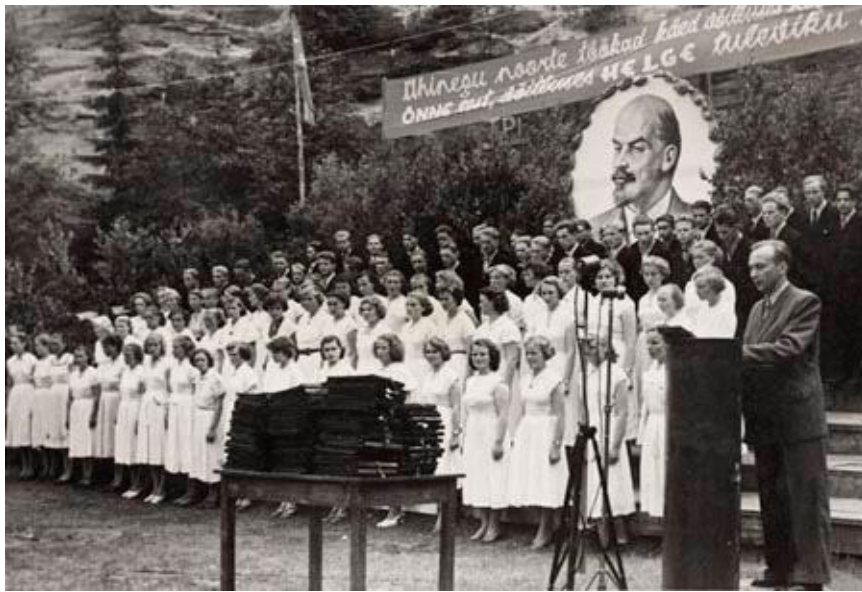
Kuva 6: Nuorten kesäpäivien todistusten jako Taevaskoda, Võru. "Liittykööt nuorten ahkerat kädet yhteen, säteilköön onni ja valoisa tulevaisuus". Kuva julkaistu omistajan luvalla.

Nuorten kesäpäivien päätösjuhla oli neuvostoyhteiskunnan sekulaari aikuistumisriitti ja sosialistisen kasvatuksen päätöstahtuma, jossa juhlittiin keskikoulunsa päättäneitä, poliittisesti täysinoppineita, aikuistuneita neuvostokansalaisia. Ohjaajille painotettiin, että Nuorten kesäpäivät ovat kaunis neuvostoperinne, ne eivät saaneet muodostua vain taisteluksi kirkollisia toimituksia vastaan. (Remmel 2008, 258.) Neuvosto-Viron luterilainen kirkko ei kieltänyt Kesäpäiville osallistuneita nuorilta mahdollisuutta myös konfirmaatioon kuten Itä-Saksassa, jossa kirkko kieltäytyi konfirmoimasta nuorisovihkimykseen osallistuneita (Köntti 1984). 1970-luvun lopulla Nuorten kesäpäivät alkoivat menettää omaleimaisuutensa. 1980-luvun kansallinen