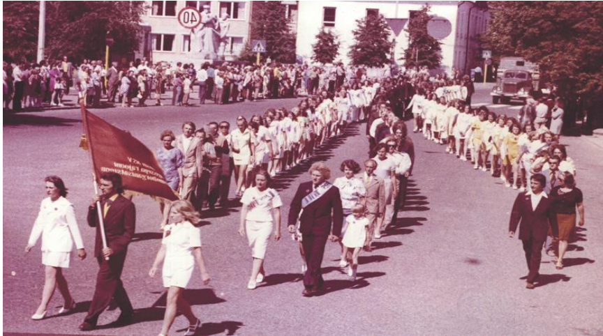
Kuva 5: Nuorten kesäpäivien juhlakulkue 1970 Kuressaaressa.