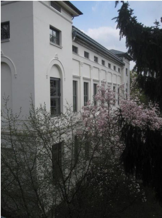
Kuva 1: Instituutin kirjasto ja vierailevien tutkijoiden työskentelytilat sijaitsevat vanhassa huvilassa aivan Braunschweigin keskustan lähellä.