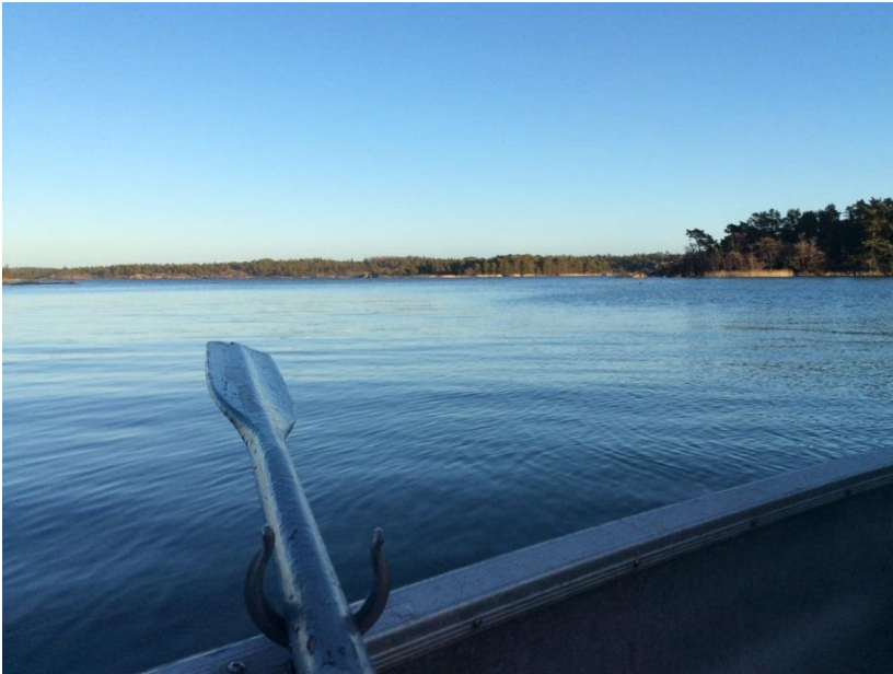
Kuva 2: Soutaminen on Lyyperissä nykyään jo harvinainen vesillä liikkumisen tapa.