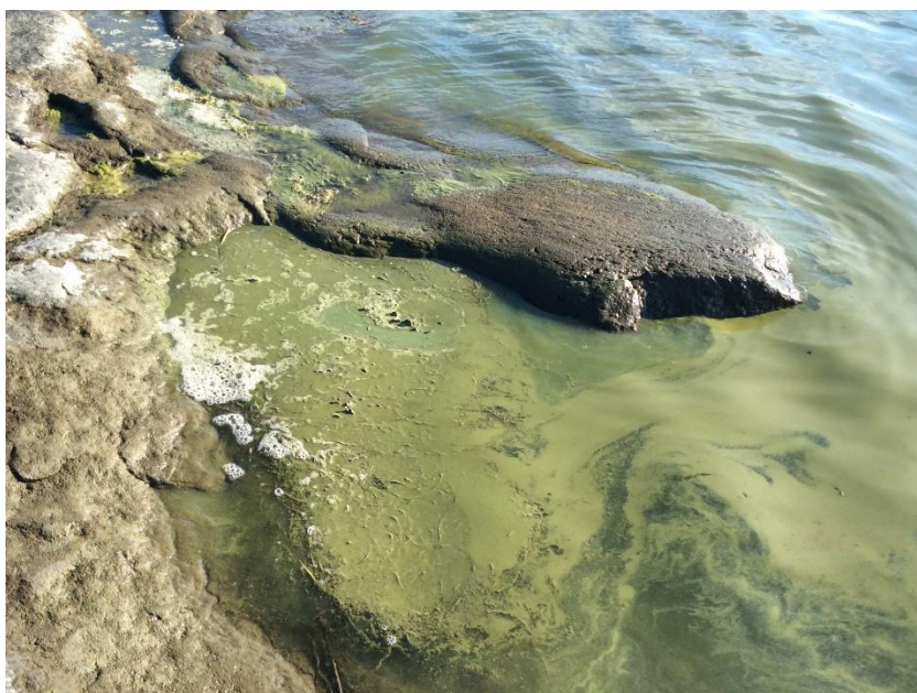
Kuva 4: Sinilevää rantavedessä. Vesi on Lypyrissä paikka, jossa paikalliset ja globaalit ongelmat risteävät.

Tutkijan tekemät valinnan hetket ovat merkityksenannon tekstualisaatiossa olennaisia. Ne ovat merkitystihentymiä, joissa jokin pitkäänkin – ehkä juuri hiljaisena tietona – hermeneuttisessa prosessissa lymyillyt toiminallinen, kokemuksellinen, ruumiillinen tai intuitiivinen tieto saa sanallisen muodon. Voidaan myös sanoa, että autoetnografinen aineisto muotoutuu heijastelemaan sellaisia teemoja, jotka tutkija mielessään käsittää tarpeellisiksi tutkimuksensa kannalta. Yhtä lailla voidaan kysyä, onko näin ajateltu tutkijan mielen toiminta ainoastaan tutkijasta vai myös tutkimuskohteen toimijoista lähtöisin. Tämä kysymys liittyy tarkastelemani kokemisen, mutta myös kuvittelemisen yhteisöllisyyteen.