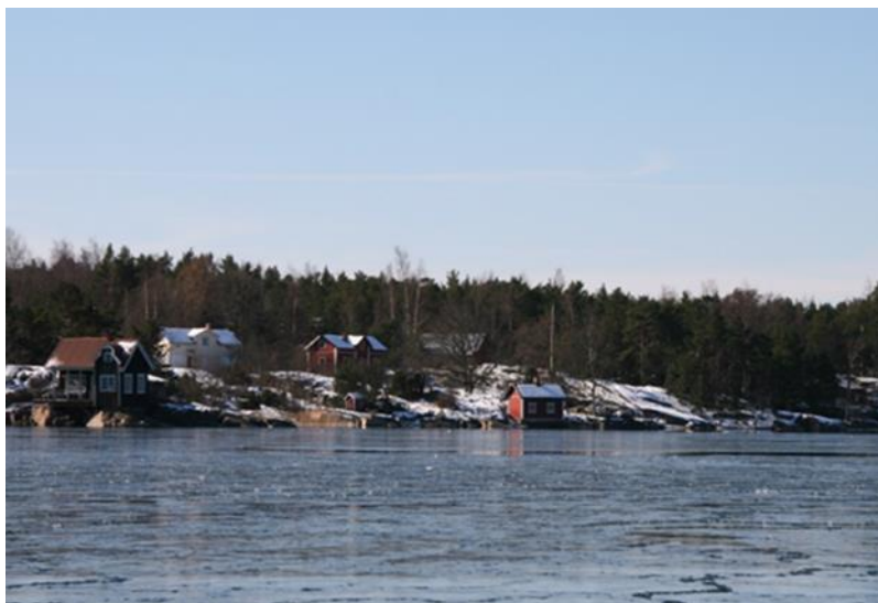
Kuva 1: Lypyrtilän kylän keskellä on vesi.

[K]aikki kasvokkaskontakteihin perustuneita varhaisimpia kyliä suuremmat yhteisöt (ja ehkäpä myös nämä kylät) – ovat kuviteltuja. Yhteisöjen erotteluperusteena ei tulekaan käyttää niiden valheellisuutta tai aitoutta, vaan tapoja, joilla ne on kuviteltu. (Anderson 2007, 39–40.)