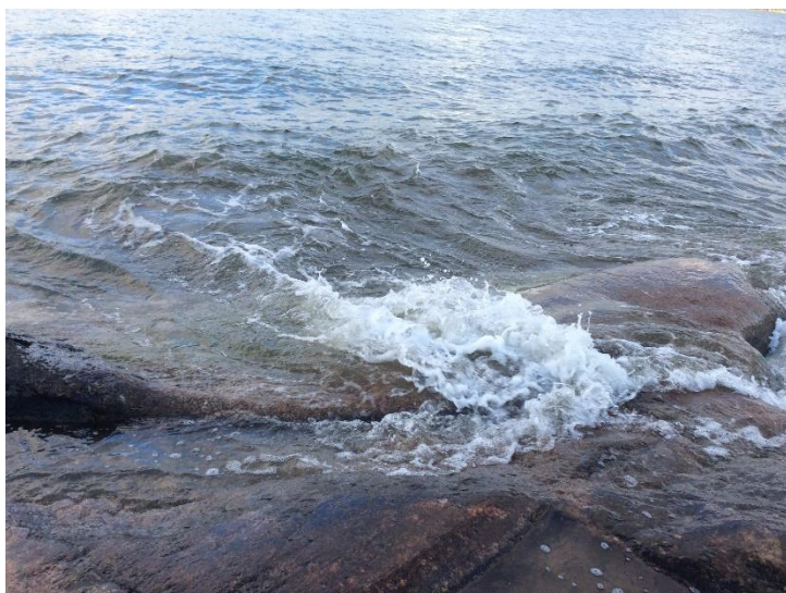
Kuva 3: Vesi on oleellinen toimija Lyypyrtissä ja sen historiantuottamisen prosessissa.

Vaikka kirjoittajana Lyypyrtin suullisen historian tekstualisaatioprosessissa kokosin merkitykset kirjalliseksi tuotteeksi, sen mahdollistivat monet merkityksenantoprosessin aikana kohtaamani inhimilliset ja ei-inhimilliset toimijat (ks. Latour 2005, 54, 212–213, 218). Jos tarkastelemme vettä ihmisen rinnalla heterogeenisenä toimijana, voimme keskittyä merkityksenantoon, siihen miten se toiminnassa tapahtuu. Aamu-uinti ei ole minulle vain virkistäytymistä, vaan veden kohtaamista, vedessä olemista. Vedessä ollessa myös ruumiin tuntemus itsestään muuttuu vaikuttuen tästä toisesta toimijasta. (Mt.)