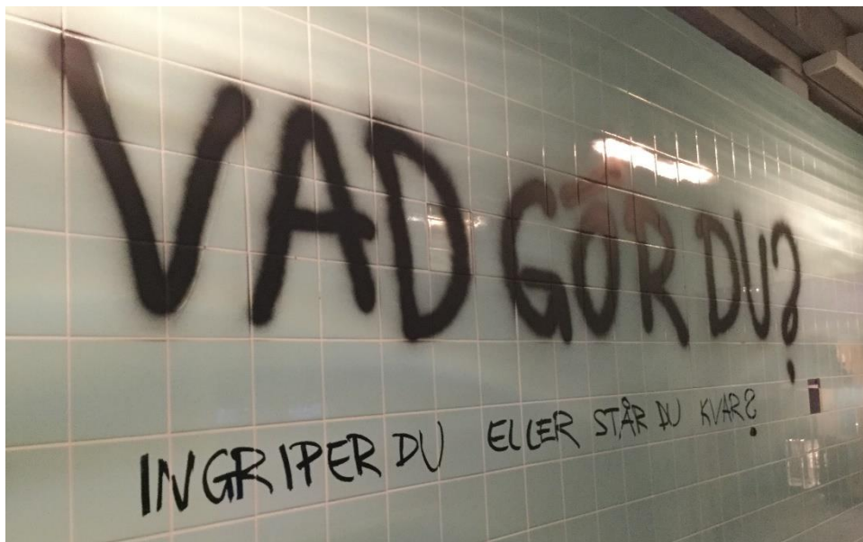
I ljud- och ljusinstallationen "hot- och vittnesgången" upplever besökaren en hatbrotts scen. Hur länge står du ut? Eller om du ser ett hatbrott, vad gör du – stannar du och hjälper, eller går du vidare och låtsas som om du inte sett?

utmana mina egna rädslor och fördomar? Utställningen utmanar ständigt besökaren till självreflektion och skiftande av perspektiv. En av poängerna är att verkligheten inte är svart-vit i betydelsen att en del är rasister och andra inte, utan att alla människor bär på fördomar och stereotyper om andra människor. Människans jag formas alltid i relation till andra i omvärlden, att strukturera medmänniskor och omvärlden i kategorier är en del av erfarenheten av att vara