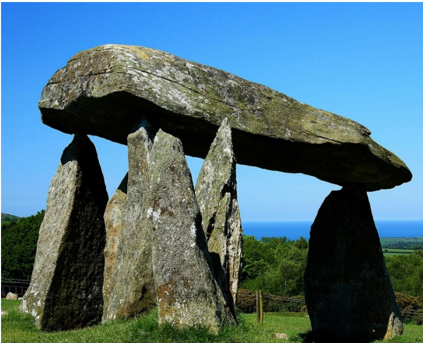
Kuva 3: Dolmen käytävähauta, Pembrokeshire, Wales.

And therefore it is [...] that from the effects and visible monuments of this first religion, we are left to guess at the cause and quality of it. Of this sort of evidence we have one great altar of stone, of considerable bigness, [...] whereon the first-fruits of the place might be offered to God by those very first men who