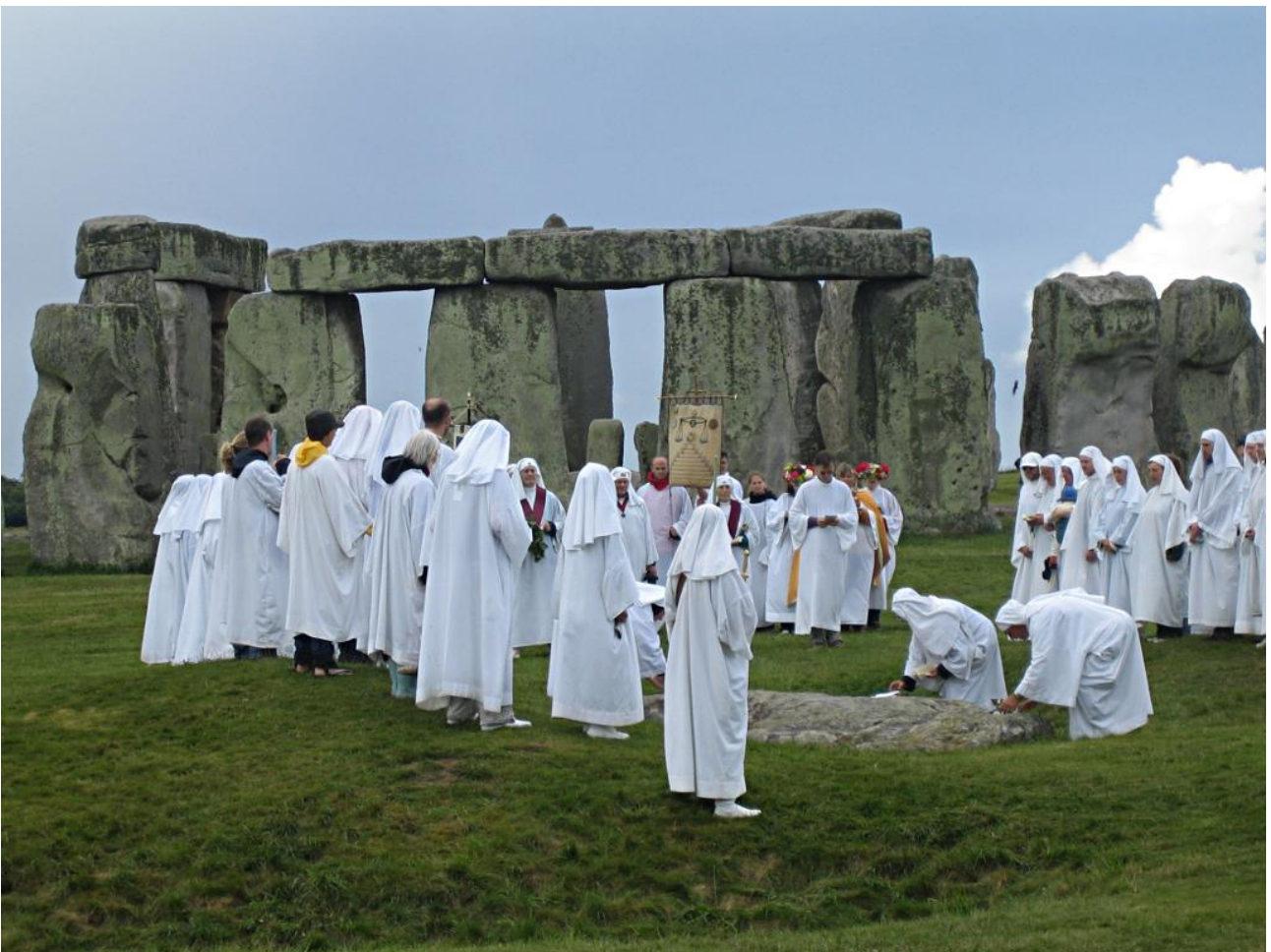
Kuva 5: Druideja Stonehengessä vuonna 2007.

vänseisaukseen liittyviä rituaaleja toimittavat nyt pääasiallisesti esihistoriallisista kulttuureista ja alkuperäiskansojen uskontoperinteistä eklektisesti ammentavat uuspakanalliset druidit, joille Stonehengen ja muiden megalittisten monumenttien 'pyhyys' ei määriy yksinomaan menneisyyden, vaan ennen kaikkea tässä hetkessä koetun esi-isien läsnäolon ja paikkaan liitetyn 'maan energian' kautta (esim. Cusack 2012). Vaikka julkisessa keskustelussa uuspakanoiden tulkinnat esitetään usein negatiivisessa valossa osana laajempaa 'pseudoarkeologiaksi' nimettyä ilmiötä (ks. Chippindale 1983, 237–267), esimerkiksi Ethan Doyle White (2016) on todennut, että uuspakanoiden megalitteihin liittämä kokemus 'pyhästä' ei lopulta ole erotettavissa niistä 'sekulaarin pyhän' tai erityislaatuisuuden merkityksistä, joita monumenteille annetaan virallisten tahojen ylläpitämässä kulttuuriperintödiskursseissa. Erilaisista lähtökohdistaan huolimatta nämä näennäisen ristiriitaiset lähestymistavat voivat toimia myös yhteistyön perustana ja siten edesauttaa molempien ryhmittymien yhteistä tavoitetta taata monumenttien säilyvyys 'muistin paikkoina' myös tuleville sukupolville.