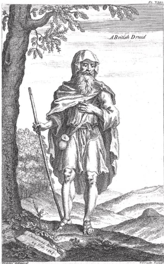
Kuva 4: William Stukeleyn omakuva druidi Chyn-donaxina (Stukeley 1740, Preface).

that true sense of Religion, which keeps the medium between ignorant superstition and learned free-thinking [...] which is no where upon the earth done, in my judgment, better than in the Church of England. (Stukeley 1740, Preface)