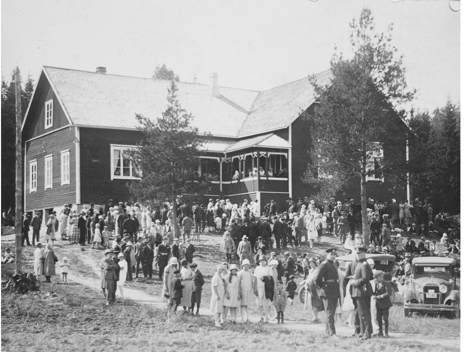
Juhlaväkeä ja kaksi poliisia Perniön työväenyhdistys Riennon talon pihalla.

tioita: kotitarkastuksia, valtiollisesti epäilyttävien henkilöiden etsintöjä ja vangitsemisia. Poliittisuus ei ollut tosin kaukana silloinkaan, kun etsittiin entisen punakaartilaisen ylläpitämää viinätehdasta tai valtiorikosoikeuden langettamaa tuomioita kärsimässä ollutta vankikarkuria. Monen rivisuojeluskuntalaisen silmissä rikollisuus ja punakaartilaisuus saattoivatkin olla yksi ja sama asia. Tällaisella ajattelulla oli väistämättä vaikutuksensa kyläyhteisön sisäisiin suhteisiin. Konfliktit ja niihin varustautuminen puolin ja toisin lisäsivät uusien konfliktien riskiä.