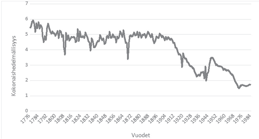
Kuvio 1: Kokonaishedelmällisyys Suomessa 1776—1980.