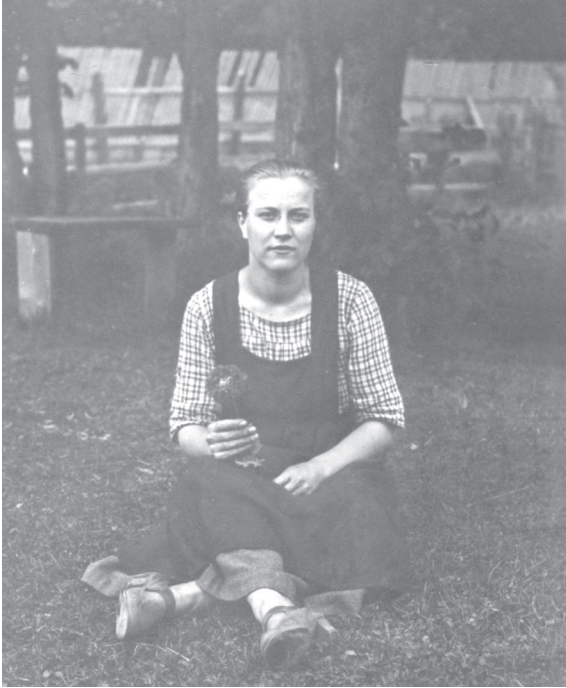
Nuori Lydia.

suhdetta uskontoon, osuuskauppaliikettä, naisten asemaa sekä yleistä tapojen turmelusta. 15