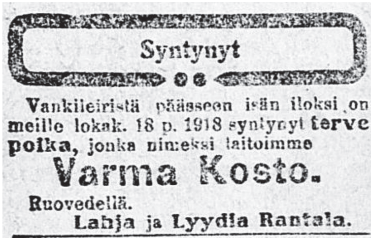
Syntymäilmoitus Suomen Sosialidemokraatissa 4.12.1918.

kertovien lähteiden tulkintaan. Sosiaalihan- nallisia ohjeita isättömiksi jääneiden lasten huoltamisesta, mutta kunnat päättivät itsenäisesti toimintamalleistaan. Kerron seuraava- vassa, miten valtakunnalliset toimintamallit välittyivät paikallis- tasolle ja kuinka ohjeita sovellettiin. Osoitan, millainen merkitys sosiaalihan- nallisuuden ohjeiden noudattamisella ja valvonnalla oli häviäjäsapuolen lasten kohteluun. Pyrin osoittamaan, miten sosiaalihan- nallisuuden valvonta ja paikkakunnan työläisemmistö- nen kunnallisvalta johtivat sodan häviäjäsapuolen jälkeläisten asialliseen kohteluun paikallisella tasolla.