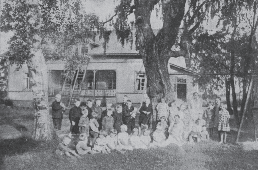
Vasun lastenkoti.