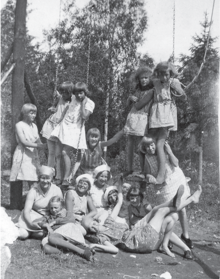
Punaorpojen ja työläislasten kesäsiirtolan tytöt ryhmäkuvassa Mäntsälässä 1930.

poja. Lapset sijoitettiin mahdollisuuksien mukaan oikeistolaisiin koteihin usein vanhan huutolaisperiaatteen mukaisesti, jolloin heidät annettiin halvimman tarjouksen tehneeseen perheeseen. Jämsässä punaorpoja käytettiin taloissa myös ilmaisena työvoimana. 108 Ruovedellä lastenkodin johtokunta kieltäytyi nuorem-