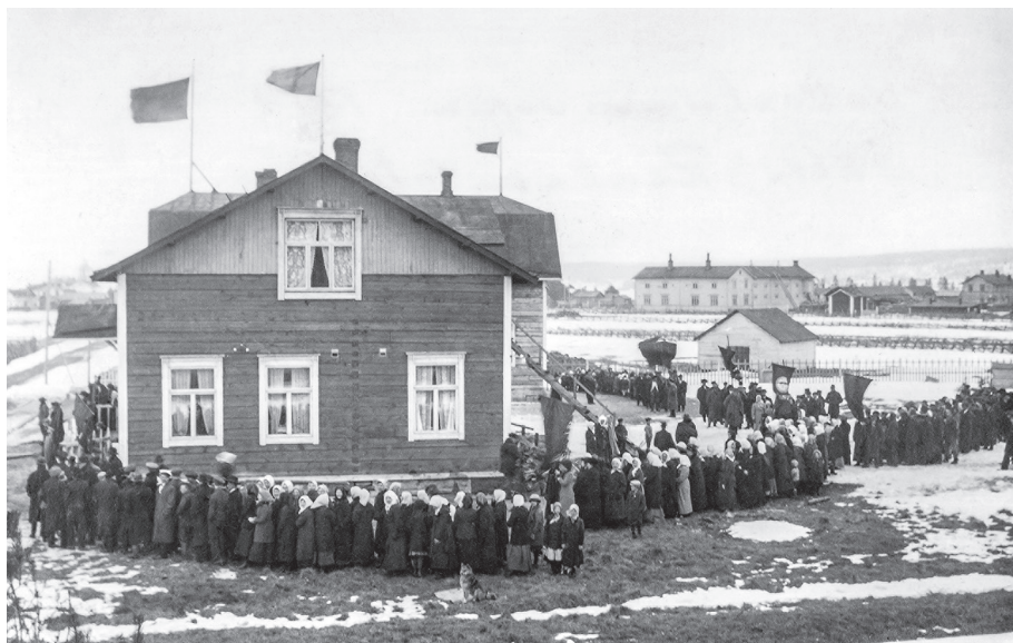
Vallankumousvappu Rovaniemellä vuonna 1917. Kulkue on lähdössä Renkaan talolta.

Yksi vallankumouksellista mielialaa lisäävä tekijä oli varmasti Haaparannan ja Tornion kautta takaisin Venäjälle matkanneet tunnetut vallankumoukselliset. Venäläisten poliittisten pakolaisten virta Euroopasta takaisin kotimaahansa alkoi Tornion raja-asemalla maaliskuun loppupuolella. Pakolaismäärät olivat vielä huhti- ja toukokuussa varsin maltillisia. Suurin ryhmä oli 15.4. saapunut 33 henkilön seurue, jota johti V. I. Lenin. Kesäkuussa vallankumouksellisten paluumuutto kiihtyi ja parhaimmillaan rajan ylittivät päivittäin kymmenet, jopa sadat venäläiset. Osa junista jatkoi suoraan Pietariin, osa pysähtyi tarkastusta varten Ouluun tai Riihimäelle. Kesäkuun 11. päivänä Tornioista lähti Oulun kautta Venäjälle juna, jossa istui yli 40 vuotta kestäneeltä pakomatkalta kotiin palaava vallankumousveteraani Pjotr Kropotkin. Oulun työväenneuvosto oli valmistautunut kunniavieraan vastaanottoon ja järjesti hänelle rautatieasemalla pieni-