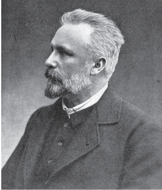
Kirjailija Arvid Järnefelt.

ten keskuuteen. 3 Kirkkopuheisiin johtaneet tapahtumat saivat alkunsa pääsiäisenä 1917, jolloin Järnefelt kävi läpi henkilökohtaisen ja hengellisen kriisin, joka kirkasti hänen ajatuksiaan suhteessa kirkkoon ja myös omiin toimintatapoihinsa: Järnefelt koki tehtäväkseen profetoimisen kirkkorahvaalle.