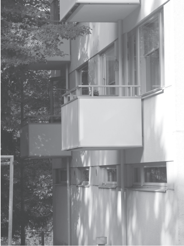
Modernin asunnon tilat ulottuvat parvekkeen kautta ulos ja yhteys luontoon saattaa olla melkein käsin kosketeltava kuten on nähtävissä tässä As Oy Sotkankulman B-talossa vuonna 2015.

perheenjäsenen oma rauha ja samalla vapaus toteutuivat, kun oli oma huone lähellä ulko-ovea. Sieltä käsin saattoi muiden huomaamatta siirtyä ulos tai tulla sisään. Modernissa amurilaistalossa erot ulko- ja sisätilojen välillä liudentuivat rappukäytävän, tilavien eteisten ja parvekkeiden myötä. Koska vuodenaajat eivät uudenaikaisessa kerrostalossa vaikuttaneet asumiseen, myös vuodenvaihtamisen merkitys väheni. Keskukslämmitys takasi sujuvan