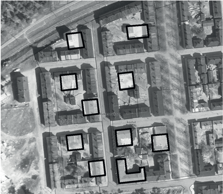
Oy Finlayson Forssa Ab:n asuntoliittinen toiminta jatkui 1960-luvulla Amurin länsireunalla. Vuonna 1965 lainvoiman saanut saneerausasema-kaava yhdisti pienemmistä tonteista suurempia kokonaisuuksia. Uudet kerrostalot (kuvassa mustalla rajauksella) sijoitettiin uusien tonttien keskiosaan. Osa Finlaysonin tehdasalueen ja Amurin korttelit yhdistävistä itä-länsisuuntaisista kaduista muutettiin kevyen liikenteen väyliksi ja alueen läpi, kuvan oikeassa reunassa etelä-pohjoissuunnassa kulkeva puiden reunustama Sotkankatu puistoksi. Kuva: Ilmakuva 1940-luku, Tampereen kaupunki, digitointi Hannele Kuitunen.