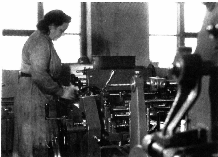
Kulutusosuuskuntien Keskusliiton metalliverstaalla työ oli 1940-luvulla naisten käsissä.

ristiriitaisia kokemuskertomuksia. Myös omat tulkintamme naisten kokemuksista ovat konstruktioita, emmekä tutkijoina pysty irtautumaan täysin kerronnan kulttuurisista malleista.