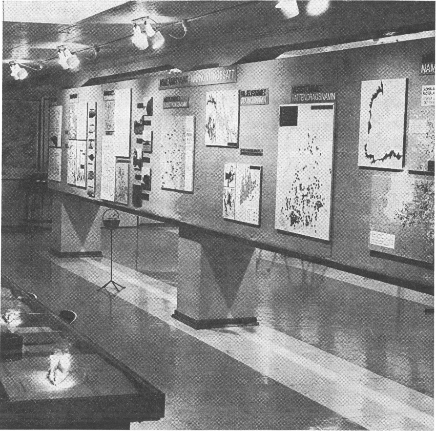
Näkymä nimeämistapoja esittelevästä seinästä.

kymmenen loppuun. Vaikka kokoelmat karttuivat 60-luvulla yli 70 000 lipun vuotuisvauhtia, on keruutilannekartassa lähes umpeen kerätyn Etelä-Suomen vastakohtana Itä- ja Pohjois-Suomessa laajoja kokonaan keräämättömiä alueita. Kokoelmien vuotuista karttuntaa kuvaava diagrammi osoittaa keruusaaliin pienentyneen ja keruun vaikeutuneen viime vuosina. Ruotsalaisen nimistön keruutilanne vaikuttaa onnekaammalta: arvioiden mukaan viiden vuoden kuluessa ruotsalaisalue saadaan kokonaan nimestetyksi.