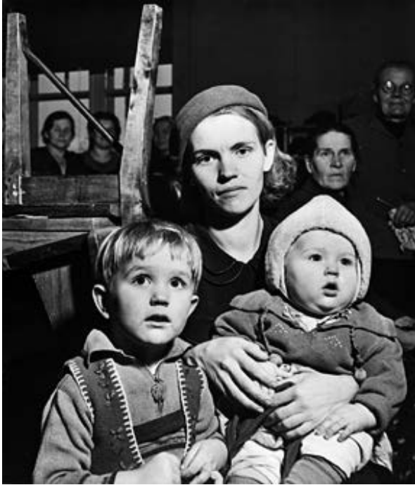
Kannaksen ranta-alueita on tyhjennetty siviileistä sekä rauhan että sodan aikoina. Kuvassa terijokelainen äiti lapsineen pakomatalla syksyllä 1939.

ja niinpä vielä vuosina 1936–1937 toimeenpannuissa kartoituksissa pohdittiin vakavasti ”sisäisen siirtolaisuuden” ottamista käyttöön alueella. 107