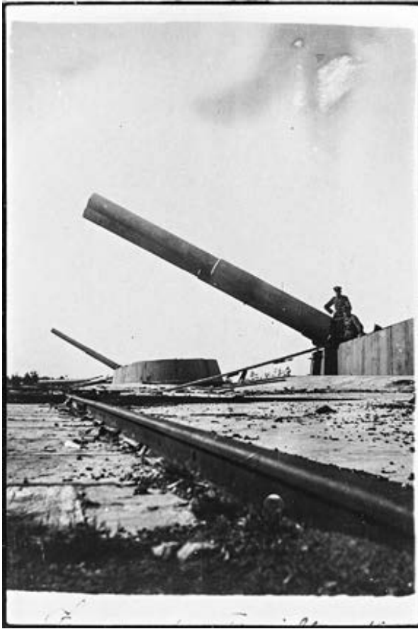
Inon patterin tykit suuntautuivat Suomenlahdelle. Kuva on vuodelta 1918.

vain 25 kilomeriä. 47 1890-luvulla liikennettä Kronstadtista suomalaiskylään oli hoitanut Kaarle-laiva, mutta linja lopetettiin kannattamattomana. 48 Kronstadtin halunneet pääsivät sinne omillakin veneillä. Terijoen kuulumista Pietarin puolustuspiiriin alleviivasivat linnoitussuunnitelmat vuonna 1909. Tuolloin venäläiset linnoitusinsinöörit mittailivat Terijoenlaikkaa puolustuslinnoitukselle ja kyselivät maanomistajilta hintoja ostaakseen näiltä ranta-alueita. 49 Valituksi tuli Terijoen naapurista Uudenkirkon Ino, jonne venäläiset rakensivat vuosina 1909–1916 jyrkän linnoituksen.