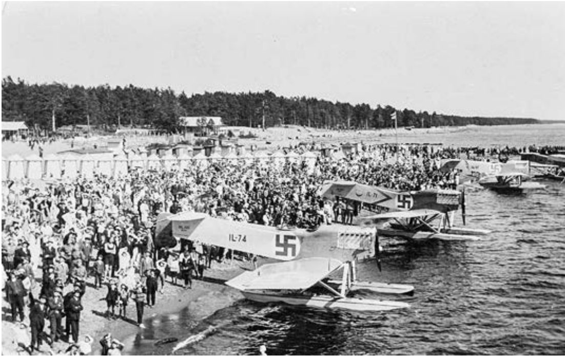
Matkailijat ja paikalliset pääsivät katsomaan rannikkoa myös ilmasta käsin. Meritasolennätystä järjestettiin Terijoen rannoilta muun muassa vuonna 1929. Taustalla uimakoppien rivistö.

turistien vaikutuksia seudun elämänmenoon. Niin ikään maanomistusoloja tutkineen komitean mukaan Kannaksen rantamaiden ulkomainen omistus ja vieras kulttuurivaikutus olivat vieneet raja-alueen väestön henkiseen ja aineelliseen kurjuuteen. Paikalliset tilalliset olivat myyneet pienet maatilansa ja siirtyneet ”helpon rahan” hankintaan eli palvelemaan venäläisiä hiekkarantaturisteja. Esimerkiksi Terijoella oli myyty huvilapalstoja vuonna 1903 pääosin ulkomaalaisille 42 kappaletta, mutta 1907 jo 163 kappaletta. Kritiikistä huolimatta myös valtio myi surutta palstojaan rajapitäjistä ulkomaalaisille, vuoteen 1907 tultaessa jo 152 palstaa. Eniten itsenäisiä tiloja oli myyty sanottuun vuoteen tultaessa Uudellakirkolla (249), toiseksi eniten Kivennavalla (122), johon tuolloin laskettiin kuuluvaksi myös Terijoki. 117