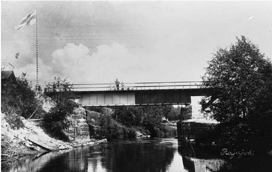
Kannaksen ranta-alueiden sosioekonomista elämää virvoitti keisariaikana Pietarin suurkaupungin meluisa elämänmeno, mutta vuoden 1917 vallankumousten jälkeen rajaseutuja alkoivat painostaa raskaasti bolsevistisen Neuvosto-Venäjän levottomuudet. Kuvassa alueita erottava kahlattavan kapea Suomenlahteen laskeva Rajajoki.

rannikkoelämälle. Synkät pilvet varjostivat seutua ensin hallinnollisen venäläistämiskauden (1908–1917) ja sitäkin synkemmin Venäjän vallankumousten sekä Suomen ja Venäjän sisällissotien raa’an ja sekasortoisen ajanjakson ajan (1917–1922). Turistina seudulla asustellut Ilmari Kianto kirjasi osuvasti ylös 1920-luvun puolivälissä, että itäisen Suomenlahden rannikko muistutti Sargassomerta, ”kadonneitten ja iäksi haaksirikkoutuneiden laivojen, hylkyjen, rumilasten, Noakin arkkiin ja Odysseuksen puuhevosien seutua”. 6