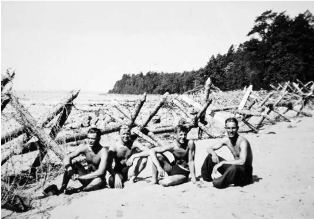
Suomalaisia sotilaita Terijoen suljetuilla hiekoilla kesällä 1942.

ta-asukkaiden lähimmät huolet liittyivät arkisempiin ongelmiin kuin ideologiseen taisteluun. Uusi raja 1918 sulki vapaan kulun Pietarin markkinoille, mikä tuhosi seudun tuottavimmat elinkeinot, rahdinajon ja monimuotoisen kaupan. Kalastuselinkeino alkoi sekin taantua nopeasti 1920 Tartossa määriteltyjen tiukkojen merialuerajojen vuoksi. Paikallisten harjoittama laaja-alainen ja ammattimainen salakuljetus kukoisti kymmenisen vuotta, mutta se saatiin tiukoilla kontrollitoimilla aisoihin 1930-luvun alkuun tultaessa.