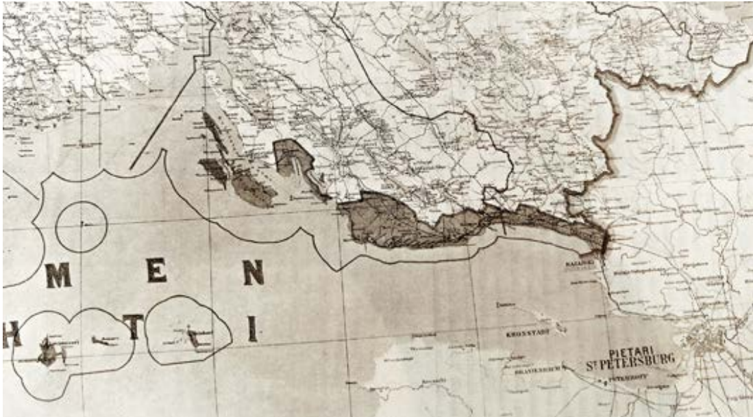
Suomenlahden itäinen rannikkoalue. Tummallalla merkittynä näkyy Suomen valtion turvallisuuden kannalta ongelmalliseksi määritelty Suomenlahden itäinen rannikkoalue. Sitä hallitsivat Kronstadtin ja Pietarin meriliikenne, sotilaalliset toimet, miinoitukset ja äänisaaste.

Suomen rauhanneuvottelijoille, mutta myös paikallisille kalastajille ja matkailijoille. Alueen ihmisten toimintapiiri kapeni merkittävästi. Rajasulkujen jälkeen Suomen Kuvalehti kirjoitti Terijoesta kuolleen kylänä, joka ennen oli ollut täydellinen kesäpaikka: nyt vilkas kylä oli muuttunut pelottavan hiljaiseksi ja lamaantuneeksi. Koristeelliset pitsihuvilat seisoivat rannoilla hylättyinä entisen elämän muistomerkkeinä. 8