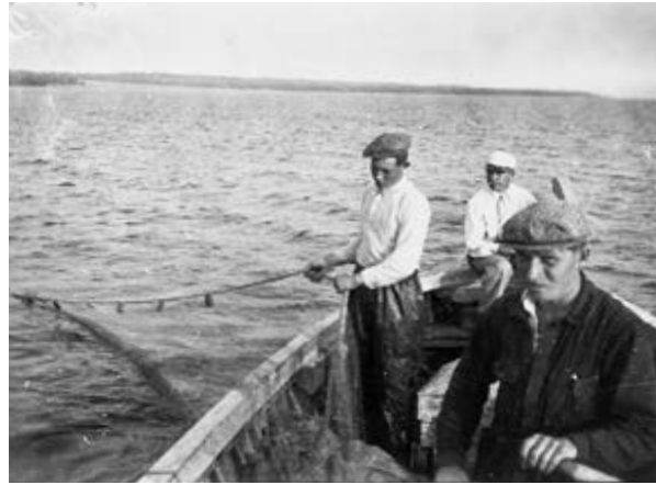
Suomenlahden itäisen rannikon apeita kalastajia 1930-luvulla.

Kalastus oli Suomenlahden itäisissä rannikkoköylissä tärkeä elinkeino vuosisadan vaihteessa rahdinajon ja venäläisturismin ohella. Vanhoista valokuvista nähdään, että osin aidatuille hiekkarannoille oli pystytetty pari-kolmemetrisiä telineitä, joissa verkot suoritettiin, puhdistettiin ja korjattiin. Suuret merirysät kuivuivat niin ikään rannoilla lokkien kirkunassa. Kalastuskunnat, isät ja pojat, kalastivat verkoilla, siimoilla ja rysillä. Vanhoja kalastustapoja harjoitettiin vielä 1920-luvun alussa, joskin ne olivat vähin erin häviämässä. Tuulastaminenkin kiellettiin vuoteen 1920 tultaessa. 77