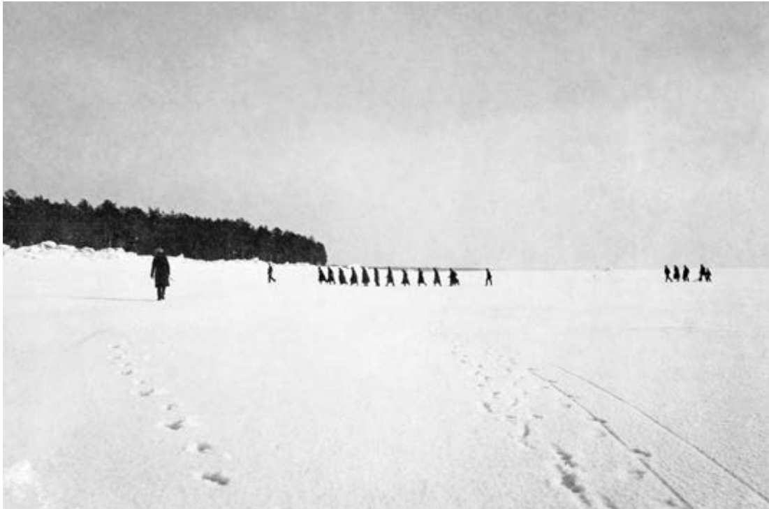
Epäonniset Kronstadtin kapinalliset pakenivat juosten Terijoelle jäitä myöten maaliskuussa 1921.

vastaan. Kapinan kukistuttua monet valkoiset kapinalliset pakenivat saarelta jäätä pitkin Terijoen rantakyliin Ollilaan ja Kuokkalaan ja muille ranta-alueille. Pakolaisia tuli noin 6 300 ja heidät sijoitettiin aluksi Inon ”keskitysleirille” Amerikan Punaisen Ristin ryhtyessä huolehtimaan heidän muonituksestaan. Inossa oli täydessä kunnossa leiri saksalais-venäläisten sotavankien vaihdon ajoilta. 69 Raja suorastaan kuhisi elämää, sillä inkeriläiset pakolaiset toivat usein mukanaan omaisuuttaan, etenkin karjaa. Eräänkin kerran rajaa ylitti pakolaisen mukana 58 lehmää, 15 hevosta sekä lukuisia muita eläimiä. 70