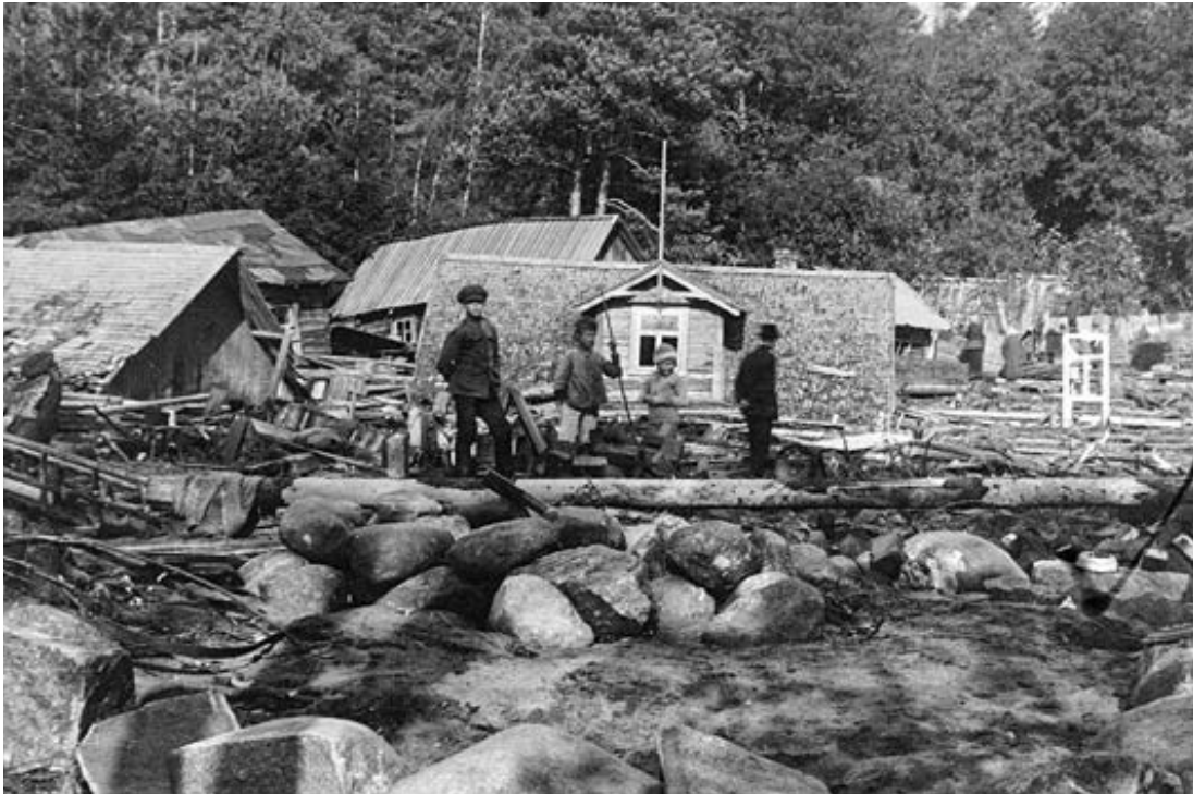
Syksyn 1924 myrskyn jälkeä Terijoella. Rakennusten tuhojen lisäksi menehtyi viisi henkilöä.

kehotus Suomen valtion luonnonsuojeluvalvojan allekirjoittamana maaliskuulta 1923. Lehtinen 'Luonto ja kotiseutu' julkaistiin Karjala -lehden välityksellä 1924 alueen luonnonsuojelun ystäville, ja siinä pyydettiin lähettämään tietoja seudun luonnosta. Valvoja halusi tietää, oliko havainnoitsijan kotiseudulla jokin luonnontilanne paikka, joka erityisesti ansaitsisi tulla säilytettäväksi jälkimaailmalle nykyisessä tilassaan ja kaipaisi suojelusta. 141 Vastaavanlaisia lentolehtisiä levitettiin kansan keskuuteen muun muassa teemoilla 'Koulu ja luonnonsuojelu' ja 'Luonnonsuojelu ja maamies' sekä 'Luonnonsuojelu ja kulttuuri'. Vastuksia näistä keruista ei vielä 1920-luvulla juurikaan saatu. 142