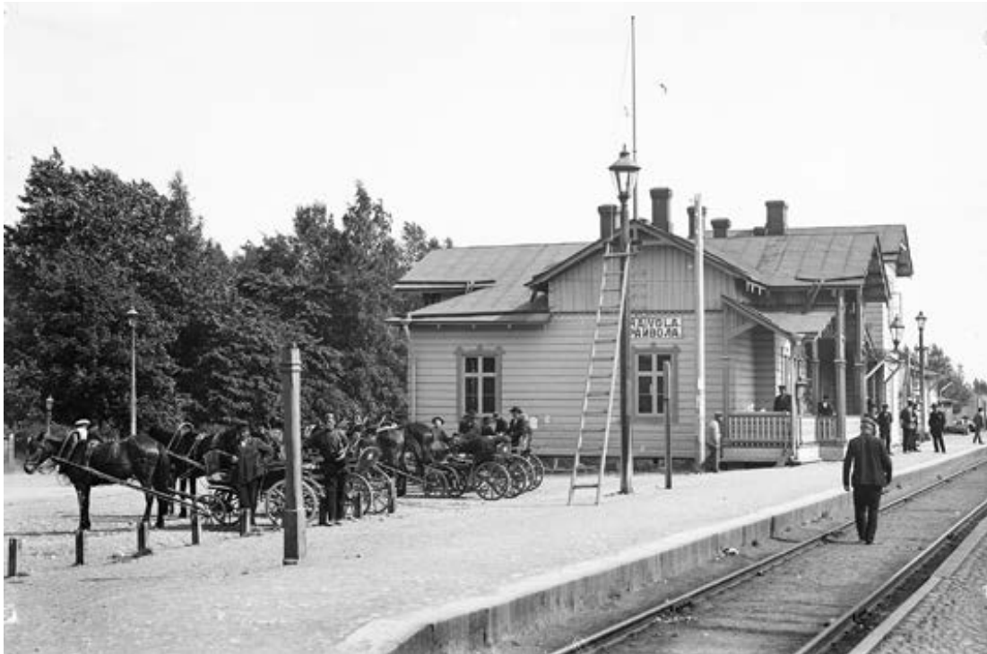
Vuokra-ajurit odottavat huvilavieraita Raivolan rautatieasemalla vuonna 1909.

omistuksessa ja vuokrauskäytössä. 44 Ulkomaalaisten kesäasukkaiden määrästä ei ole tarkkaa tietoa, mutta johtopäätöksiä on tehty nimismiehelle näytettyjen passien lukumäärästä. Vuonna 1896, jolloin Terijoki vielä oli osa Kivennapaa, Kivennavan nimismiehelle näytettyjä passeja oli 6 282. Jos passilla oli kolme henkilöä, ulkomaalaisten kesäasukkaiden määrä kunnassa kyseisenä vuonna olisi voinut olla jopa 20 000. Vuonna 1906 pelkästään Terijoen nimismiespiirissä esitettyjä passeja oli 10 114. Sen jälkeen Terijoella näytettyjen passien määrä kasvoi vuosittain: vuonna 1911 passinäyttöjä oli noin 15 000–16 000, mikä lienee merkinnyt liki 50 000:ta kesävierasta. Paikkakunnan asukasluku oli tuolloin noin 3 500 henkeä. 45