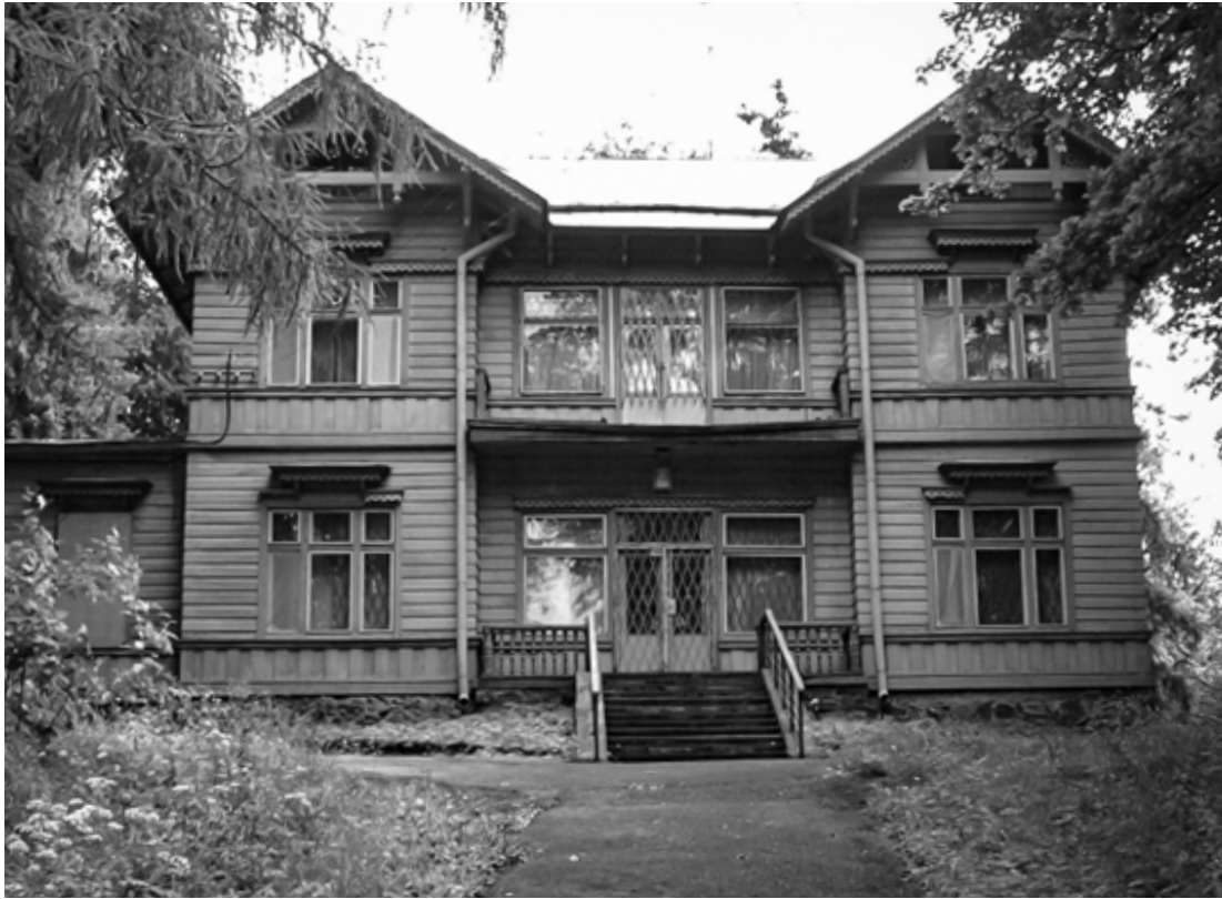
Keisarin henkilölääkäri Botkinin taatsa Uudellakirkolla Kirstinälän kylässä. Kuva on otettu vuonna 2010.

Kuolemajärven historiategos kuvaa tulipaloa Vuitshin hovin riihellä. Siihen liittyneet tapahtumat kertoivat Pihkalan kyläläisten ja huvila-asukkaiden hyvistä suhteista. Hovin väki ihmetteli, kun kyläläiset tulivat vapaaehtoisesti sammuttamaan paloa ja järjesti sitten heille kiitokseksi juhlat. Teos kertoo hovin neitien tarjoutuneen opettamaan kylän lapsille venäjän luku- ja kirjoitustaitoa, mutta harvojen suomalaislasten käyttäneen tilaisuutta hyväkseen. Vuitshin hovi antoi myös lääkinnällistä apua paikallisille asukkaille. 102 Huviloiden ja maatilojen omistajien joukossa oli useita lääkäreitä aina keisarin henkilölääkäri Botkinista alkaen, eikä ollut harvinaista, että he auttoivat, kun joku paikkuntalainen tarvitsi lääkärin apua. 103