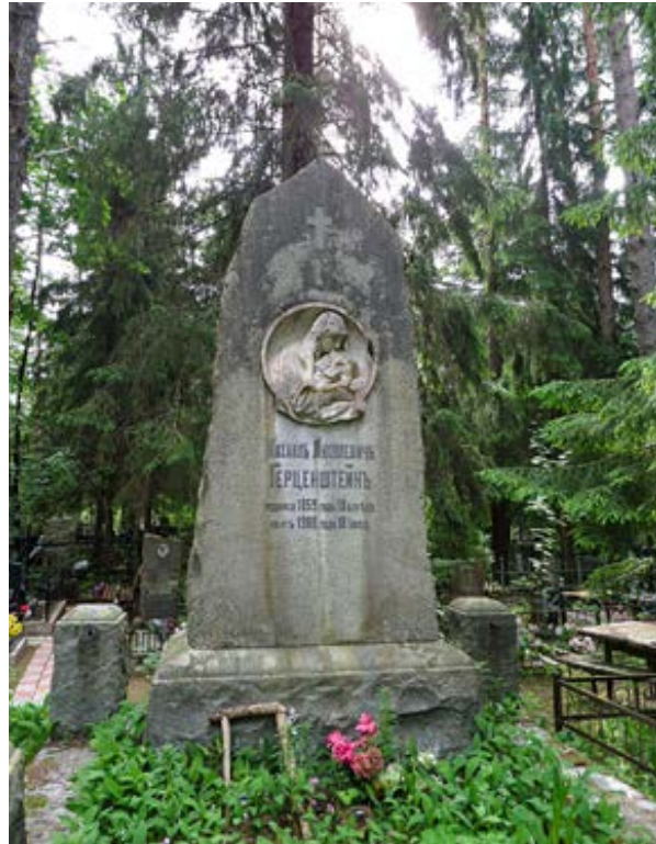
Mihail Herzenstein murhattiin Terijoella heinäkuussa 1906 ja hänet haudattiin ortodoksiselle hautausmaalle. Herzensteinin hautakivi vuonna 2014.