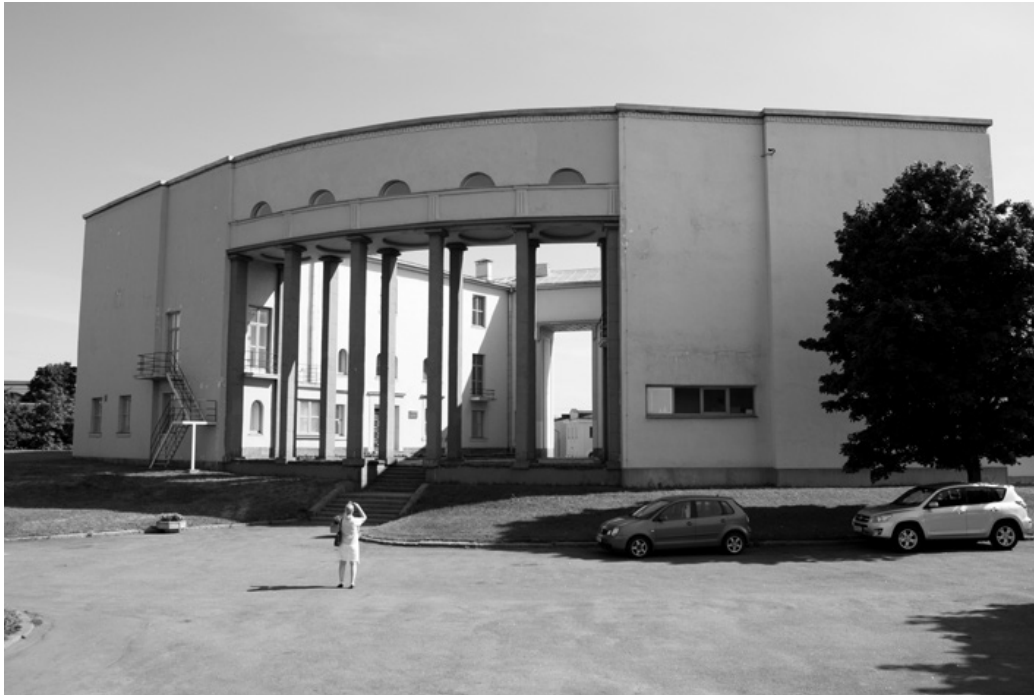
Viipurin kunnostettu taidemuseo meren puolelta katsottuna vuonna 2014.

samantapainen kuin muiden Länsi- ja Pohjois-Euroopan vastaavankokoisten kaupunkien eliiteillä. Harrastuneisuus ja seurallisuus loivat kauppiasporvariston ja henkistä pääomaa tuottavien tahojen välille luontevan vuorovaikutussuhteen eikä yksiselitteistä rajaa esimerkiksi taiteilija- tai kirjailijapiirien ja talouseliitin amatöörien välillä ollut. Musiikin, kirjallisuuden, teatterin, tanssin ja kuvataiteen harrastaminen tai keräily oli lähes yhtä luonnollinen osa seuraelämää kuin hyvät käytöstavat tai korrekti pukeutuminen. Avoimuus muualta maailmasta ja erityisesti Länsi-Euroopasta tuleville vaikutteille sekä aito kiinnostus esteettisiin ja filosofisiin kysymyksiin näkyivät vahvasti paitsi taidekokoelmissa, myös tietoisuutena uusimmista tyylistä, oli kyse kaunokirjallisesta modernismista, kansallisromantiikasta taikka kubismista.