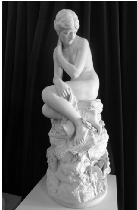
Johannes Takasen (1849–1885) marmori- veistos Andromeda