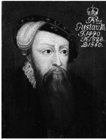
Kuningas Kustaa Vaasa (1496-1560)