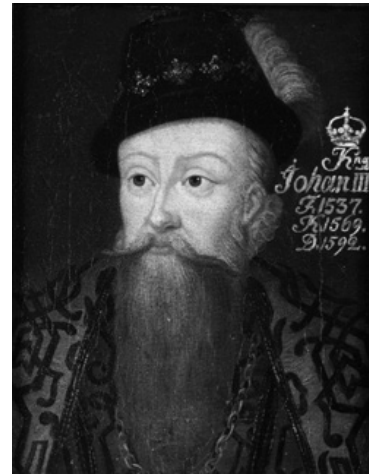
Kuningas Juhana III (1537-1592)