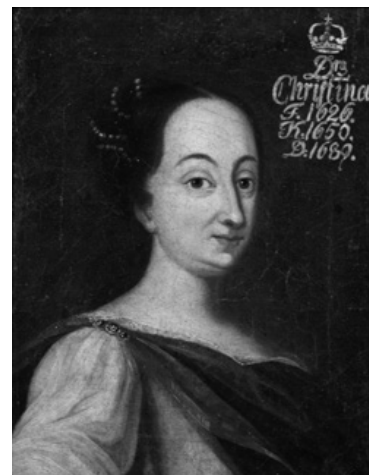
Kuningatar Kristiina (1626-1689)

mattilaiset ja maalarit siirtyivät kuninkaallisten linnojen työmaalta toiselle, mutta myös konterfejarit viettivät kiertelevää elämää ja kulkivat laajalla alueella etsimässä työtilauksia. Arvostetuimpia työtilaisuuksia tarjosivat laajennettavien ja ajanmukaistettavien linnojen rakennus- ja sisustushankkeet. Linnojen edustustiloihin hankittiin myös laajoja virallisuonteisia muotokuvasarjoja.