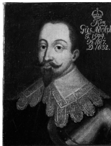
Kuningas Kustaa II Aadolf (1594-1632)