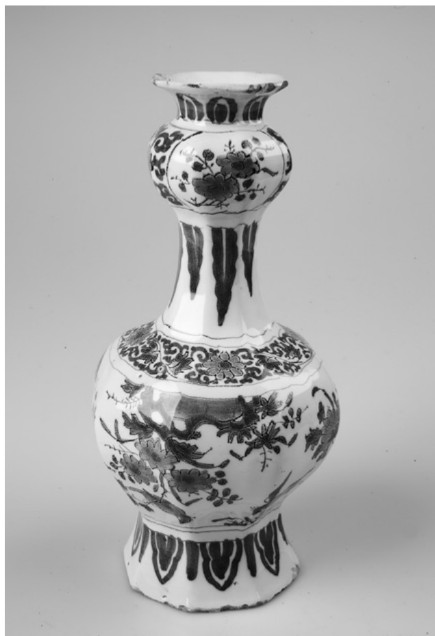
Grommén kokoelmaan kuulunut delftiläinen maljakko 1600-luvun Viipurin museon kokoelmista.

Nimitys konterfeijari tulee latinan muotokuva tarkoittavasta sanasta contrafactum . 13 Mallina istuvasta henkilöstä maalattu muotokuva edellytti kykyä ikuistaa kuvattavan persoonalliset ja tunnistettavat piirteet ainakin pääpiirteissään. Muotokuvamaalarin nimike, joka samalla kattoi laajemmin myös muun taulumaalauksen, kuvaa hyvin taidemaalareiden toimenkuvan esiastetta Itämeren alueen kaupungeissa. Taidemaalaus oli vakiintunut selkeämmin omaksi elinkeinoalaksi Hollannin tasavallassa ja muualla Keski-Euroopassa, jossa muotokuvamaalaus laskettiin raamatullisten ja historiallisten aiheiden