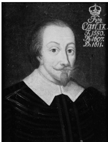
Kuningas Kaarle IX (1550-1611)