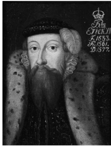
Kuningas Eerik XIV (1533-1577)