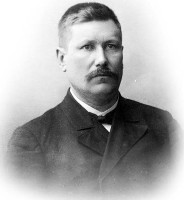
Viilaaja Juho Kirves oli pitkäaikainen SDP:n kansanedustaja Viipurin läänin läntisestä vaalipiiristä. Kirves toimi kansanvaltuuskunnan jäsenenä ja siirtyi vuonna 1918 Venäjälle, jossa hän myöhemmin katosi.

kaartien aseelliset yhteenotot alkoivat täällä tammikuussa 1918 aikaisemmin kuin muualla Suomessa.