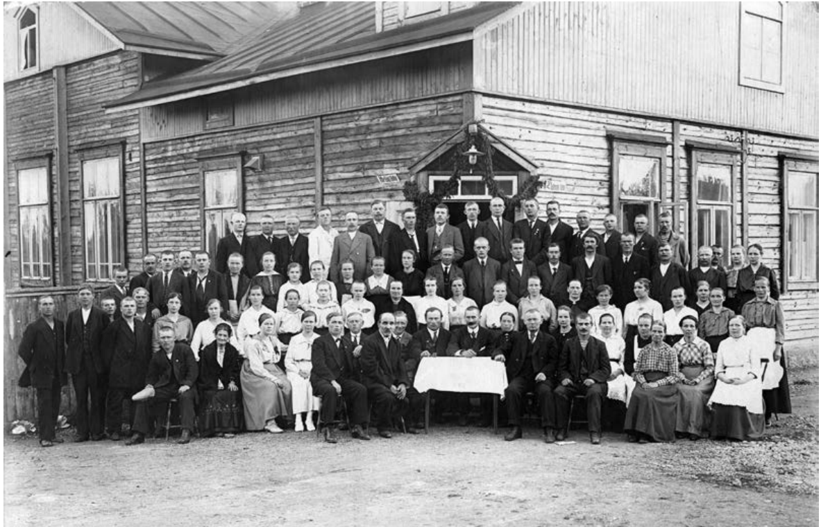
Sorvalin työväenyhdistys perustettiin vuonna 1902 ja sen Heljäskadun ja Batterinkadun kulmassa sijainnut talo valmistui 1907. Kuvassa työväenyhdistyksen jäseniä talon edustalla 1910-luvun alkuvuosina.

kärjistyneet, eivät ryhmien välit tulehtuneet yhtä pahasti kuin Helsingissä. Yhtenä synnä muodollisen sovun säilymiselle oli se, että tieto punaisen julistuksen sisällöstä tavoitti Viipurin työväen vasta lakon loppuvaiheessa. 66