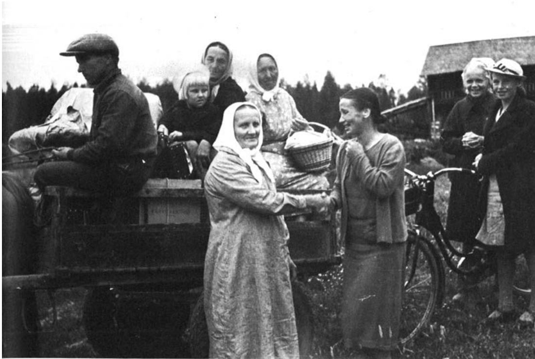
Sodan seurauksena karjalaiset joutuivat jättämään kotiseutunsa.

Karjalan evakoiden historia tiivistetään oppikirjoissa yleensä kuvaan maantiellä kulkevasta reki- tai vaunujonosta. Vaikka valokuvien avulla on joissakin kirjoissa pyritty havainnollistamaan evakoinnin raskasta emotionaalista puolta, toisissa, kuten yllä olevassa Katajamäen, Laitisen ja Viekin Elävää historiaa -kirjan kuvassa kuvateksti ”Sodan seurauksena karjalaiset joutuivat jättämään kotiseutunsa.” tarjoaa varsin vähän avaimia kuvan sisältämien tunteiden tulkitsemiseksi.