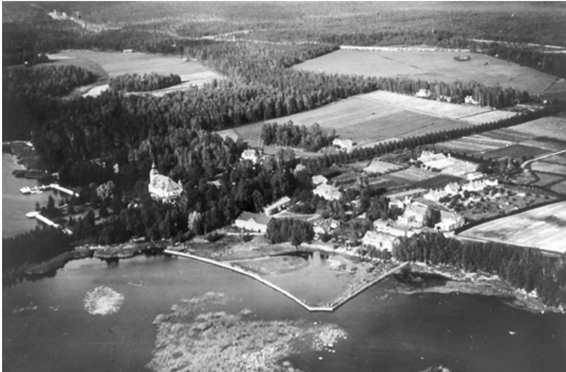
Ilmakuva Kirjolan alueesta 1934.

Kirjolaan ja sai sieltä avoimesti neuvoja, kasveja, taimia sekä apua myös oman siipikarjatuotannon aloittamiseen. Lähiympäristössään hovi oli mallitila uudistuksiin.