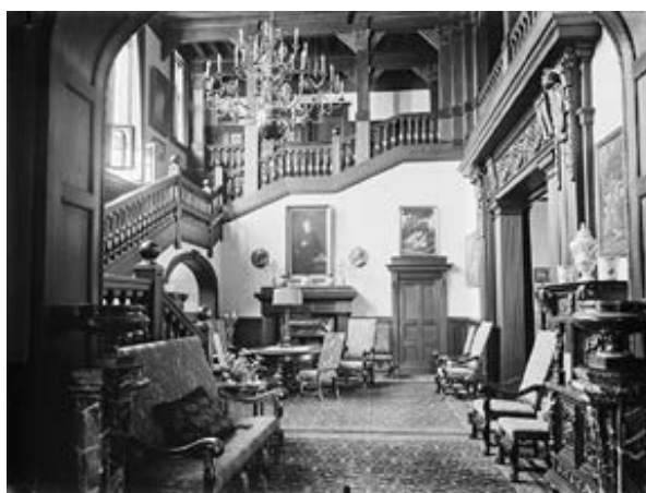
Uusi päärakennus pihan puolelta ja aulatala 1912.