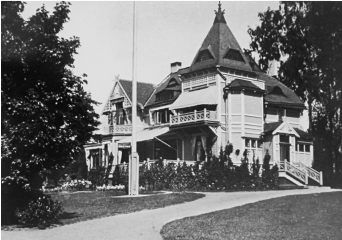
Stora villan todennäköisesti vuonna 1912.

päätti purkaa koko rakennuksen ja teettää uuden kestävämmiin materiaalein. Väliaikaiseksi kesäasumisen keskuksesi korjattiin sitä ennen pihapiirin toiseksi suurin rakennus Stora villan. 24