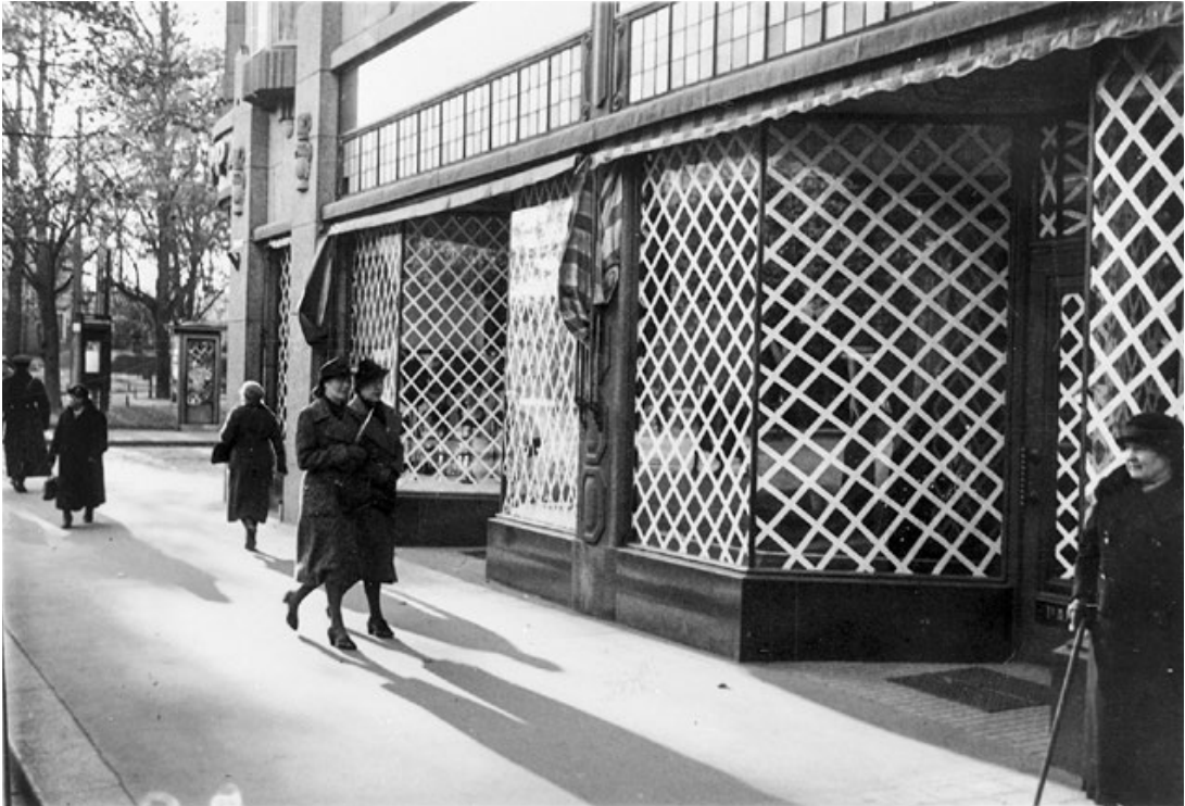
Sodan uhka alkoi näkyä viipurilaisessa katukuvassa syksyllä 1939: näyteikkunat on teipattu sirpalevahinkojen välttämiseksi, jos kaupunkia pommitetaan. Valokuvaaja O. Tetri. Museovirasto. Historian kuvakokoelma. HK19451228:66.33.

muokkasivat viipurilaisten sota-ajan kokemushistoriaa. Viipuri joutui sodassa kokemaan jyrkkiä katkoksia ja väkivaltaisia murtumia: kaupungin tyhjentäminen ja tuhoutuminen talvisodassa, ensimmäinen neuvostokausi 1940–1941, takaisinvaltaus ja lyhyt suomalainen jälleenrakennuskausi jatkosodassa sekä lopulta Viipurin toinen menetys ja kolmas vallanvaihto kesällä 1944. Kivimäki kuvaa sekä viipurilaisten kokemusten erityisyyttä että niiden yhtymäkohtia muuhun Eurooppaan.