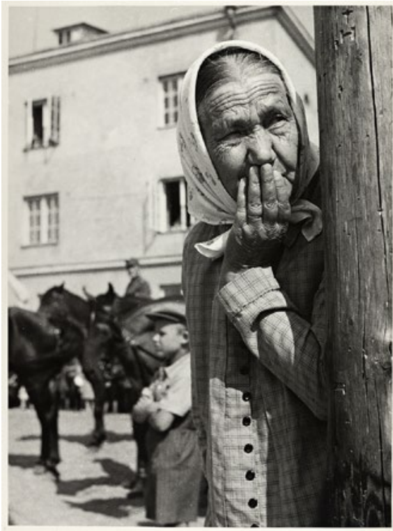
Nainen tarkkailee Karjalankannaksella elokuussa 1939 järjestettyjen sotaharjoitusten päätösparaatia Viipurissa. Sota Euroopassa alkoi noin kahden viikon kuluttua. HK19630423:96.

päässeet näkyviin. Toisen maailmansodan osalta esimerkiksi Berliinin, Budapestin, Leningradin, Moskovan ja Stalingradin taisteluista on julkaistu monografioita, joissa siviilien toiminta ja kokemukset ovat yhtä lailla tärkeitä kuin sotilaiden. 8 Tarkastelua rajaavana tekijänä on kuitenkin yleensä ollut jokin kyseiseen kaupunkiin tiivistynyt sotatapahtuma, joka on toiminut tutkimuksen motiivina: taistelu, piiritys, ilmahyökkäys, valtakamppailu. Omassa kirjassamme näkökulma on toisenlainen. Viipuriin liittyviä sota-toimia talvisodan loppuvaiheessa 1940, kaupungin takaisinvaltauksen yhteydessä 1941 ja kesäkuussa 1944 on kuvattu aiemmassa sotahistoriallisessa tutkimuksessa moneen kertaan. 9 Alkuperäislähteille menemällä näistäkin sotatapahtumista löytyisi varmasti uutta sanottavaa, mutta tähän emme ole kirjassa juurikaan ryhtyneet. Sen sijaan olemme valinneet kaupunki- ja kaupunkilaislähtöisemmän lähestymistavan: mitä toisen maailmansodan