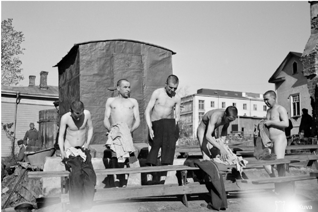
Pilkkukuumeen torjunta johti parempaan hygieniaan, koska sotavangit ja heidän vaatteensa saunotettiin ja alusvaatteet vaihdettiin puhtaisiin. Kuvassa sotavankeja täisaunassa Viipurissa syyskuun lopussa 1942. 50628.

vangeilta leikattiin hiusten lisäksi muutkin ihokarvat tarkoin pois. Vasta sen jälkeen vangit vietiin puoleksi tunniksi 80-asteiseen saunaan, missä he peseytyivät saippualla. Vaatteet käsiteltiin kuumentamalla niitä erillisessä saunaan vähintään 85 asteen lämmössä puolitoista tuntia. Saunotuksen jälkeen vangit saivat puhtaat ja myöhemmässä vaiheessa vielä kuumakäsitellyt alusvaatteet, koska oli todettu, että tait levisivät joskus myös puhtaan pyykin mukana. Saunasta vangit vietiin rikitettyyn parakkiin. 81 Sauna oli myös sosiaalisen kohtaamisen paikka, jossa valvonta oli heikompaa kuin avoimella kasarmilla. Saunassa tapahtui kaupankäynnin lisäksi myös varkaustapauksia. 82 Kesällä sotavangeille oli varattu oma, piikkilangalla aidattu uimaranta Nummikadun ja Antinkadun länsipuolelta. Muille uimarannoille sotavangeilla ei ollut asiaa. 83