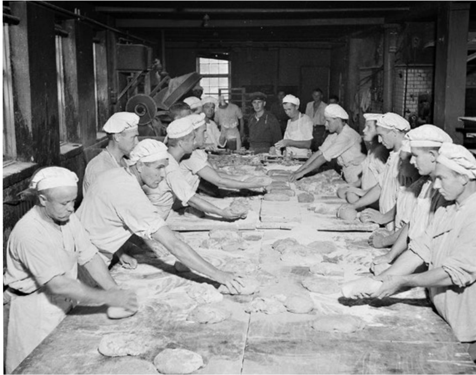
Sotavankileiri 6 oli kuin kaupunki kaupungissa. Leirin huolto työllisti sotavankeja muun muassa leipomossa. Valokuvaaja: Hedenström. SA-kuva. 50571.

si, sillä sotavangin hyödyllisyys on aina ollut merkittävä tekijä hänen selviytymisessään vankeudesta. 70