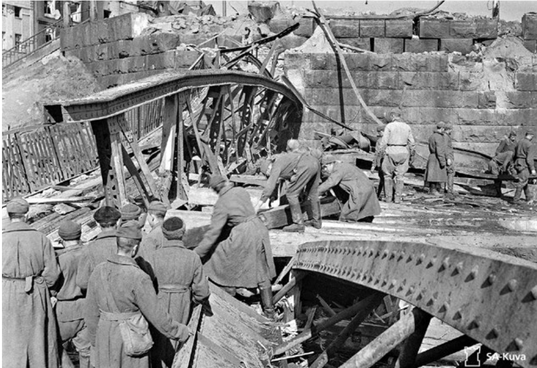
Rata kaupungista Tienhaaraan piti saada kuntoon, jotta joukkoja ja varusteita päästäisiin kuljettamaan rautateitse Viipuriin kautta. Sadat sotavangit kunnostivat asema-alueita ja rataa useamman viikon, kunnes korjausjuna vihdoinkin saapui Viipuriin 24.9.1941. Kuvassa on sotavankeja korjaamassa Papulan rautatiesiltaa 7.9.1941.