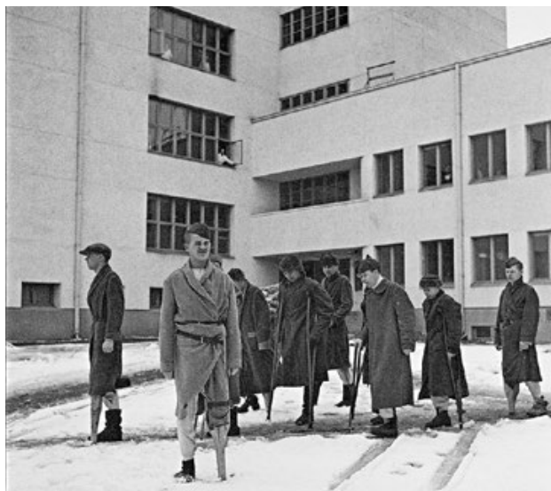
Venäläisiä invalidisotavankeja 64. sotasairaalan pihalla huh- tikuussa 1942. Potilaiden vaatteet olivat sekalainen valikoima omia varusteita, sotasaalista ja Suomen armeijan ylijäämää. 47005.