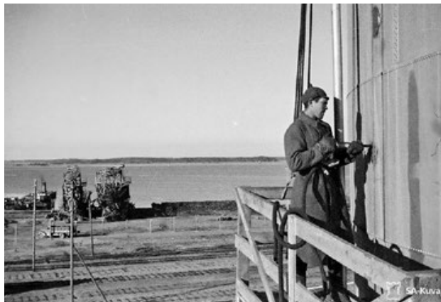
Osa sotavangeista oli ammattimiehiä, joita ilman Viipurin jälleenrakennus olisi ollut huomattavasti hitaampaa. Kuvassa sotavanki korjaamassa öljysäiliötä syyskuussa 1941. 53868.

Viipurissa osa sotavankien majoitustiloiksi suunnitelluista rakennuksista paljastui venäläisten jäljiltä niin huonokuntoisiksi, että niitä ei voitu heti käyttää edes sotavankien majoittamiseen. Viipurin lääninvankilaan suunniteltiin syyskuun alussa sijoitettavaksi 1 500 vankia, mutta vankila oli korjattavana vielä marraskuussa 1941. Tiloja ei sitten koskaan saatu sotavankileirin käyttöön. Sen sijaan Neitsytniemen kasarmeilta löydettiin tilat 2 000 vangille ja Tervaniemen kasarmeille sijoitettiin syksyn mittaan suunnilleen saman verran sotavankeja. Loput sotavankileiri 6:n vangit sijoitettiin kaupungin ulkopuolelle Sommeen, Römpötin, Kaukjärven, Heinjoen, Säkijärven, Särkijärven ja Tuomiojan leireille, joilla oli parhaimmillaan yhteensä 200 työpistettä. Alaleirien majoitustilat olivat enimmäkseen pahvi- tai lautaparakkeja, joissa oli kamiina tai muurattu uuni. Tilanahtaus oli joillain alaleireillä ajoittain merkittävä, toisilla taas oli paljonkin tilaa. Tilanne vaihteli päivästä toiseen riippuen siitä, olivatko alaleirin vangit majoitettuna