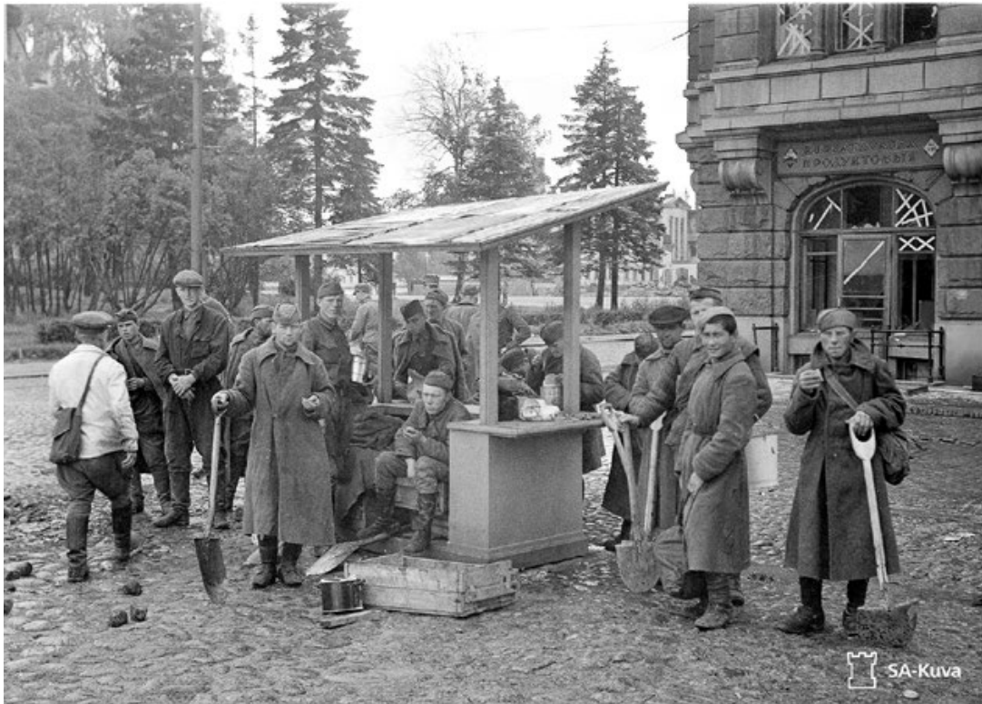
Raivaustöissä olleet sotavangit liikkuvat varsin vapaasti kaupungilla koko syksyn 1941. Kuvassa on sotavankeja lapioineen Yhdyspankin kulmalla. Kojussa tarjolla ollut tuore kala on houkutelut heidät paikalle. Valokuvaaja: vänrikki M. Pietinen. SA-kuva. 64891.

Ajatuksena oli, että vangeista muodostettaisiin sotavankikomppanioita linnointusrakennuspataljoonien alaisuuteen. Jatkosodan ensimmäisinä kuukausina sotavankileirejä perustettiin ja lakkautettiin paikallisen työvoimantarpeen mukaan. Jo 28.6.1941 oli perustettu samalla numerolla kulkeva sotavankileiri 6 Tuusulaan, mutta se oli lakkautettu pian, koska niin kaukana rintamasta ei ollut tarpeeksi sotavankeja eikä heille sopivia työpaikkoja. 13