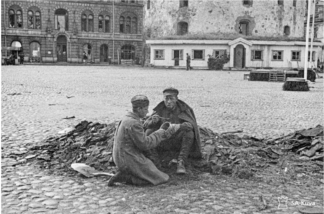
Kaksi sotavankia ruokatauolla Pyöreän tornin edustalla syyskuun alussa 1941. Sotavangit pantiin raivaustöihin heti Viipurin valtauksen jälkeen. Varusteista ja työvoimasta oli pulaa, joten vankien varusteet olivat kehnot ja vartiointi viitteellistä. Pakkeja on vain yksi eikä lapiotakaan näy kuin yksi.