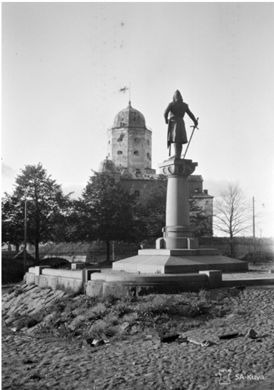
Viipurin linnassa hulmuava Suomen lippu ja Torkkeli Knautinpojan patsas jatkosodan alussa

Vingahti viimana taas sotajousi vierellä Viipurin vanhan muurin. Taivaalle latvoin ja paatehen juurin hulmahti lippu ja salkohon nousi.