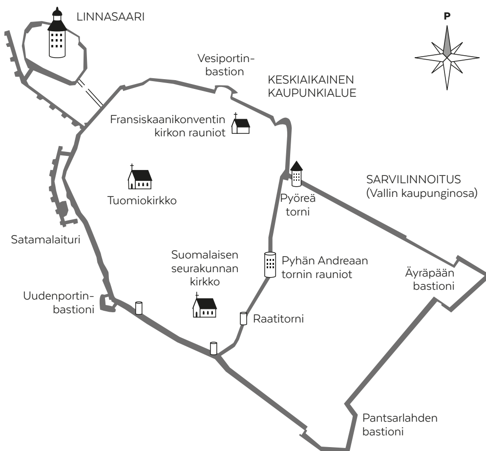
Yleiskuva Viipurin keskeisistä osista ja rakennuksista Ruotsin ajalla.