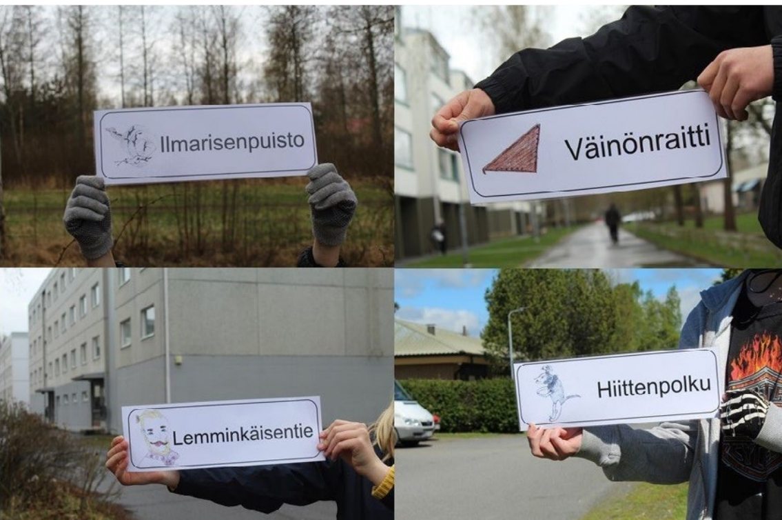
KUVA 3 Kuvassa kooste koululaisten tekemistä kalevalaisista katukylteistä kuvattuina niiden oikeilla paikoillaan Porin Väinölässä.

oikeasti asua juuri tässä ja täällä on jotakin suohon laulettua oloista” (kp/2021). Kohteena Joukahaisen puisto on kaavoituksen unohdettu kolkka. Se näkyy nimettynä kartalla, mutta oikeasta koordinaatista löytyy vain pajupusikko ja oja. Väinönraitilla yksi kyltti kuvittanut tyttö näki toiveikkuutta paikan ja kuvittamansa kannelta soittavan Väinämöisen välillä. Raitti on koivujen reunustama kävelytie kerrostalojen välissä. Hän totesi, että ”tässä olisi kiva, jos joku voisi ihan rauhassa soittaa kannelta ja muut kuunnella, minäkin näkisin sen ikkunastani” (kp/2021). Lemminkäisentien kylttiä kuvatessa yksi ohikulkija ilmoittautui kadun omaksi Lemminkäiseksi. ”Hei sä oot piirtänyt mut siihen, hän totesi kylttiä pitelevälle tytölle”. (kp/2021). Kukaan koululaisista ei ollut valinnut kuvittamaansa kylttiä sen paikan takia, vaan pelkästään nimen takia. Nimien suhde paikkaan konkretisoitui vasta, kun kuvasimme kylttejä niiden oikeilla paikoillaan. Nimet myös ohjasivat etsimään omasta ympäristöstä aivan uusia paikkoja.