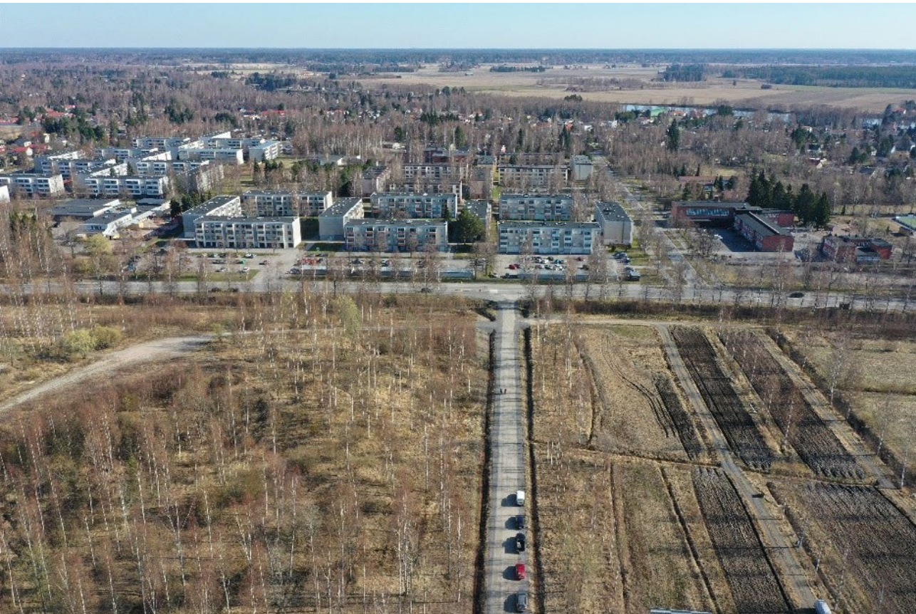
KUVA 1 Kartoituksen menetelminä käytettiin myös drone-kuvausta, jonka avulla pyrittiin löytämään reittejä ja polkuja virkistysalueilta. Tässä näkyy kuvan keskeltä alalaidasta lyhyt-aaltoaseman puistosta lähtevä Radioasemantie kohti 1970-luvulla rakennettua kerrostaloaluetta.

Kulttuurikartoitus on paikkasidonnainen menetelmä ja tapa nähdä ja kerätä monimenetelmällinen aineisto ja näin tuoda aluesuunnitteluun uudenlaisia kulttuurillisia voimavaroja (Duxbury ym., 2015; Hovi, 2021b, s. 30; Häyrynen, 2017; Nummi, 2017, s. 193, 2020). Siihen ei liity vakiintunutta tapaa analysoida kerättyä aineistoa, vaan tutkimuksellinen viitekehys voidaan valita tapauskohtaisesti.