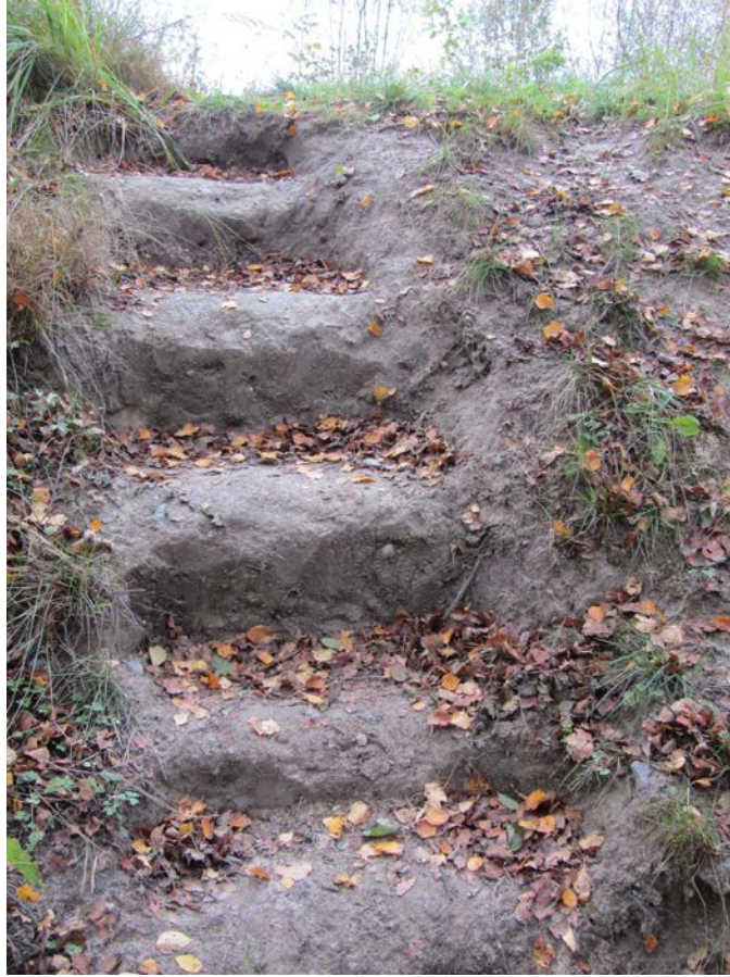
KUVA 7 Toukarissa jokirannoille on syntynyt ajanviettopaikkoja ja venevalkamia. Niitä käyttävät harrastuskalastajat, metsästäjät ja veneilijät. Joenvarsiluontoa ja erilaisia esineitä muokataan luovin tavoin palvelemaan virkistyskäyttäjien tarpeita. Rannalta voi löytää kaapelikelasta tehdyn pöydän, puistonpenkkejä ja savustuspönttöjä. Saviseen penkereeseen on muotoiltu portaat helpottamaan Jokisatamanpolulta rantaan kävelemistä.

Toisaalta affektiivinen vuorovaikutus näkyi myös jokirantojen kerrostuneessa kulttuurimaisemassa, joka oli muotoutunut hybridisesti kulttuuristen käyttöjen ja luonnon prosessien yhteisvaikutuksesta. Jokirantojen ja juovanvarsien käytön pitkää jatkuvuutta ylläpitivät vuosisatoja vanhat kävelyreitit, joiden funktio oli muuttunut mutta käyttötavat säilyneet samankaltaisina. Hankkeessa korostuivat reittien ja niiden mahdollistaman rantojen saavutettavuuden merkitys asukkaille, niihin kytkeytyvä kehollinen kokemus kaupunkitilasta ja kaupunkiluonnosta sekä joen ja sen vaiheiden kiinnittyminen asukkaiden elämänhistorioihin ja sukupolvikokemuksiin. Rantojen