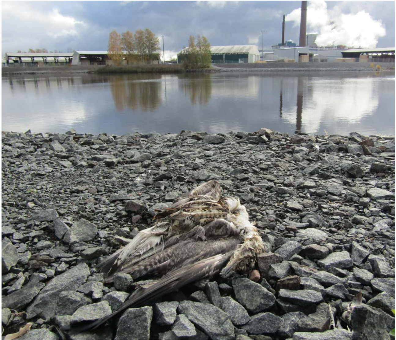
KUVA 6 Nuoren harmaalokin raato tulvapenkereellä Konepajanrannassa. Kuvanottopaikka on maantieteellisesti Porin kantakaupungin yleiskaava-alueen keskellä. Vanhan teollisuuskaupungin keskiosaa hallitsee leveä jokiuoma siltoineen ja teollisuuden ympärille rakennutunut miljöö. Ilmatilaa hallitsevat lokkilinnut, varikset ja naakat. Nuorten harmaalokkien kuolleisuus kaupunkialueella on hyvin korkea muun muassa lintujen suolistoon joutuvien tupakantumppien takia.

kaupunkia luonnonelementin, jonka rinnalla ihminen ja kaupungin massiivisetkin rakenteet näyttäytyvät hauraina. Kokemäenjoki on aivan muuta kuin Aurajoki Turussa tai Raumanjoki Raumalla. Se on raaka, tuulinen, massiivinen ja tuottaa keskusta-alueillekin paljon avointa tilaa. Kaupunkisuunnittelulle se tuottaa tiettyjä teknisiä haasteita. Esimerkiksi Etelärannassa kaupunkisuunnittelun tavoitteena ollutta edustavaa oleskelukeskustaa on ollut vaikea toteuttaa. Eteläranta kirkkoineen ja vanhoine kivitaloineen on Porin