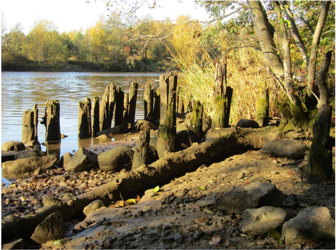
KUVA 5 Ihmisen ja luonnon aiemmat vuorovaikutusprosessit näkyvät kaupunkiluonnossa sekä elävän luonnon rakenteina että artefaktien jäänteinä. Luotsinmäenjuovan rannat ovat olleet aikoinaan kauttaaltaan paalutettuja uiton helpottamiseksi. Paalutus esti tukkien juutumista kiinni rantahiekkaan ja sumien syntymistä.

1980-luvulta lähtien. Joen saastumisesta ja puhdistumisesta puhuttiin paljon, ja ne näyttäytyivät aineistossa sukupolvikokemuksina. Iäkkäämmät porilaiset muistivat joen hyvin saastuneena. He muistelivat pahaa hajua ja “paskalta” näyttänyttä kiintoainetta joen pinnalla. Muistot sävyttivät mielikuvia joesta osin edelleen. Joen arvostuksesta sen ollessa huonoimmassa kunnossa kertoo esimerkiksi se, että Aittaluotoon joen rannalle 1960-luvulla rakennettujen kerrostalojen parvekkeet ovat sisämaan puolella. Joen puoleisessa osassa pihaa ei ilmeisesti juuri edes oleskella. Nykyään esimerkiksi Karjarantaan rakennettujen uusien kerrostaloasuntojen kysyntä taas perustuu nimenomaan joelle päin avautuviin suuriin parvekkeisiin. Vielä 1990-luvulla jopa Etelärannan arvokiinteistöjen neliöhinnat olivat hyvin alhaiset, koska jokeen liitettiin kielteisiä mielikuvia.