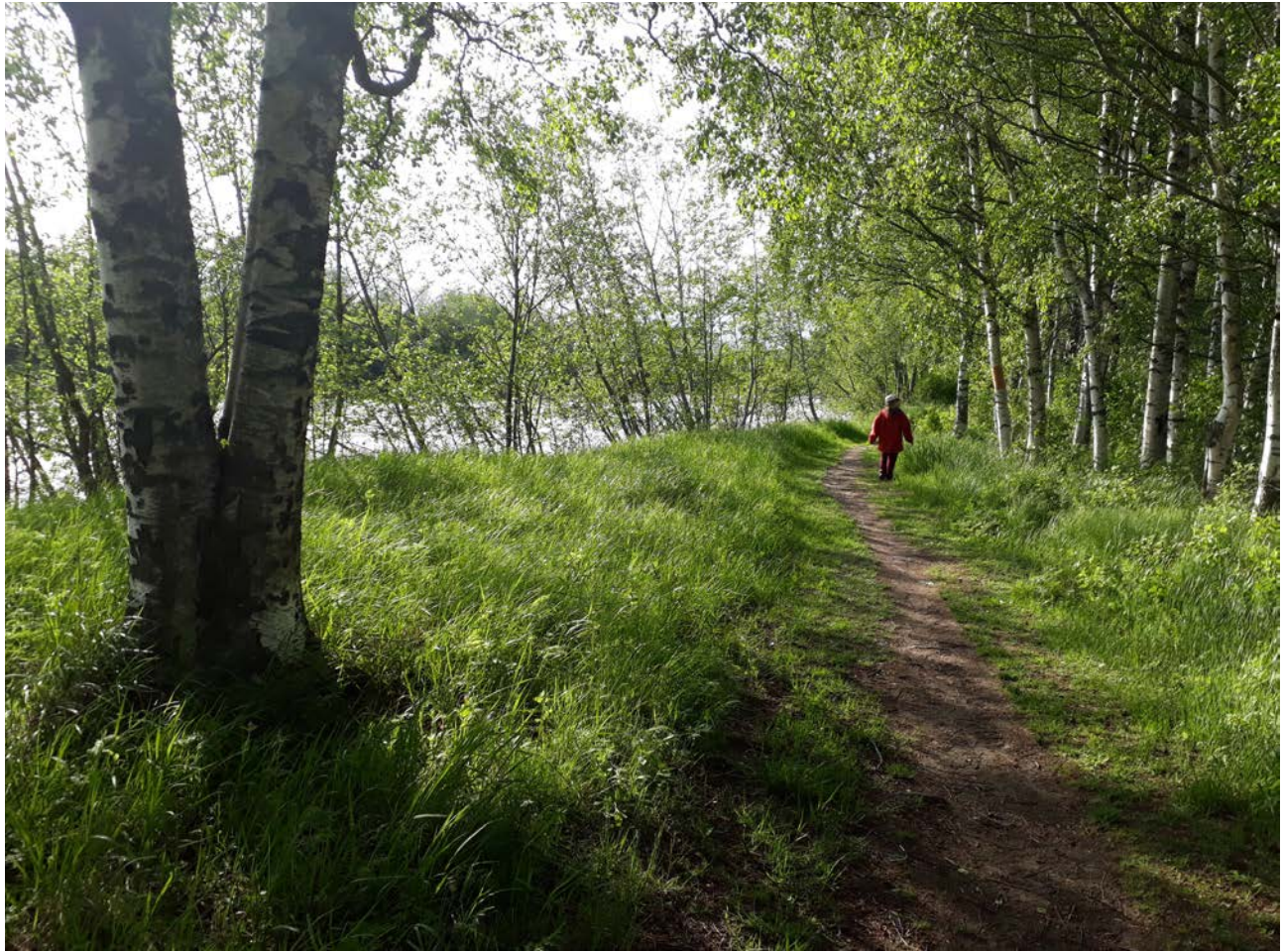
KUVA 4 Pormestarinluodon rantapolku Luotsinmäenjuovan varressa on Porin rakastetuimpia viheralueita. Sen suosio perustuu luontaiseen kasvillisuuteen ja puuston hyvin luontaisenkaltaiseen rakenteeseen. Nämä mahdollistavat kapeallakin puustoisella kaistaleella runsaan linnuston, vaimentavat liikenteen ääniä ja tuovat tunnun ”luonnossa” sisällä olemisesta.

tavoittamaan mahdollisimman monen ikäisiä ihmisiä ja tasapuolisesti sekä miehiä että naisia. Nuorimmat go along -haastattelut olivat noin 6–8-vuotiaita vanhempiensa seurassa, vanhimmat noin 90-vuotiaita.