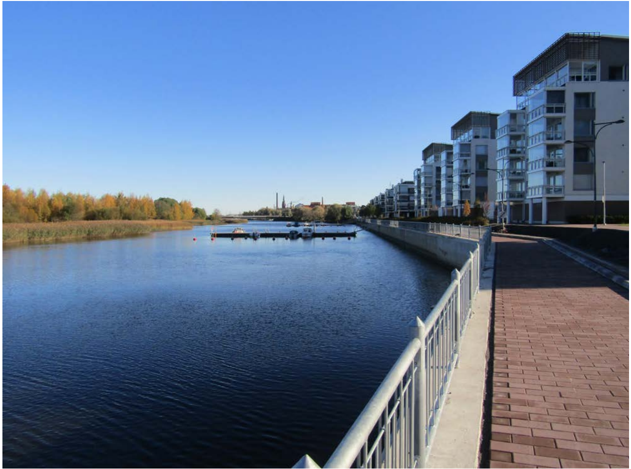
KUVA 1 Karjarannan alue Raumanjuovan etelärannalla on muuttumassa teollisuusalueesta asuinalueeksi. Aiemmin alueella toimi öljysatama, metalli- ja elintarviketeollisuutta, muun muassa teurastamo ja oluttehdas. Alueelle on noussut kuluneen kymmenen vuoden aikana kerrostaloja ja tiiviisti rakennetuista pientaloista koostuva asuntomessualue. Erityisesti messualueen paikalla ollutta puustoista rantavyöhykettä ei säästetty lainkaan, vaan kaupunkiluonto sai väistyä rakentamisen tieltä. Vastarannalla Polsanluodon ja Liljanluotojen luontaiset lehdot ovat osa keskustan puistoaluetta. Näissä kaupunkiluonnon ottamisen mukaan keskustan ”paraatipuistojen” alueelle voi ajatella edustavan uudenlaista, kaupunkiluonnon arvon ymmärtävää viheraluesuunnittelua.

siin asetelmiin törmätään kaupunkisuunnittelun lisäksi muillakin alueilla, kuten metsänhoidossa (Hankonen, 2022).