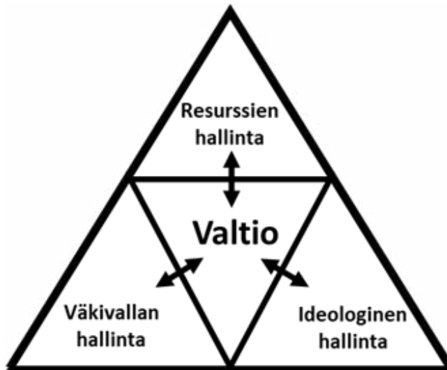
KUVA 5 Valtion hallinta

Johtaako eliitti valtiota tai valtio eliittiä? Vastaus riippuu tietysti katsantokannasta. Edellisessä tapauksessa resurssija hallitsevat käyttävät poliittista valtaa, jälkimmäisessä tapauksessa poliittisen vallan käyttäjät hallitsevat resurssija. Yleisen jaon mukaan maailma jakaantuu liberaaleihin demokra-