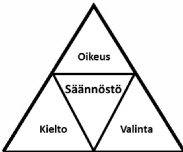
KUVA 3 Säännösten rakenne

Positiivinen ja negatiivinen säännöstö pistää miettimään säännöttömyyden tilaa, joka muodostuu oikeuksien ja kieltojen negatiivisista. Oikeuden kieltäminen synnyttää valinnanvaraisuuden tilaa, kieltojen kieltäminen vuorostaan kaikkea mahdollistavaa tilaa. (Greimas, 1984) Toimivaa säännöstöä on vaikeaa kuvitella ilman kieltojen olemassaoloa. Pelkkiin kieltoihin perustuva säännöstö olisi vuorostaan pakkopaitana niin laaja ja monimutkainen, että sen ylläpito kävisi mahdottomaksi. Oikeuksien, kieltojen ja valinnanvaraisuuksien tulee olla tasapainossa (Kuva 3.).