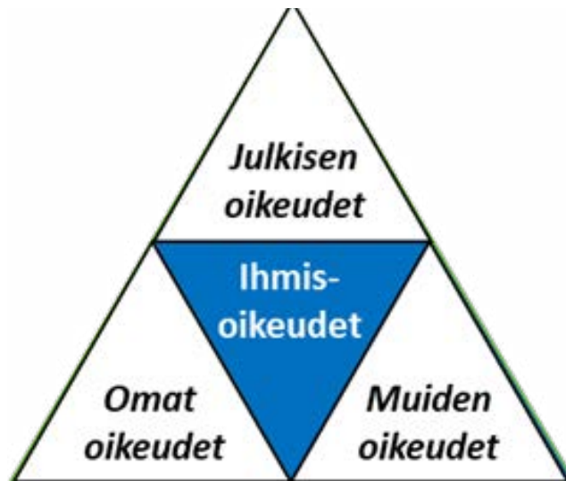
KUVA 2 Oikeuksien rakenne

Ajatus jokaiselle kuuluvista jakamattomista ihmisoikeuksista on vanha, mutta tapa perustella näitä oikeuksia riippuu historiallisista olosuhteista. Ihmisoikeuksien looginen perusta on kuitenkin aina sama: Minun oikeuteni tulee olla myös kaikkien muiden henkilöiden oikeutta. Ihmisoikeudet ovat siis jakamattomia ja universaaleja. Ne eivät saa olla keskenään ristiriitaisia eivätkä vain tiettyjen ryhmien oikeuksia. Lisäksi ihmisoikeudet tulee kollektiivisesti turvata niin, että rikkomuksia estetään ja sanktioidaan julkisen oikeudella (Kuva 2).