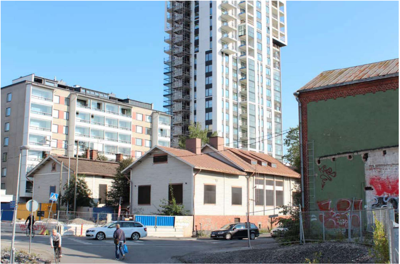
KUVA 3 Tammelan täydennysrakentamista vuonna 2018. Edessä oikealla vanha tavara-asema. Taustalla näkyy uusi Luminary-tornitalo.

pysyvä, eikä menneeseen voida palata (Wylie 2016, 411–412). Paikkaan kiinnittyminen on ihmisille tärkeää, jonka vuoksi suunnitelmat, jotka eivät huomioi ihmisten kokemuksia saavat helposti huonon vastaanoton (Kuusisto-Arponen ym. 2014, 29–31).