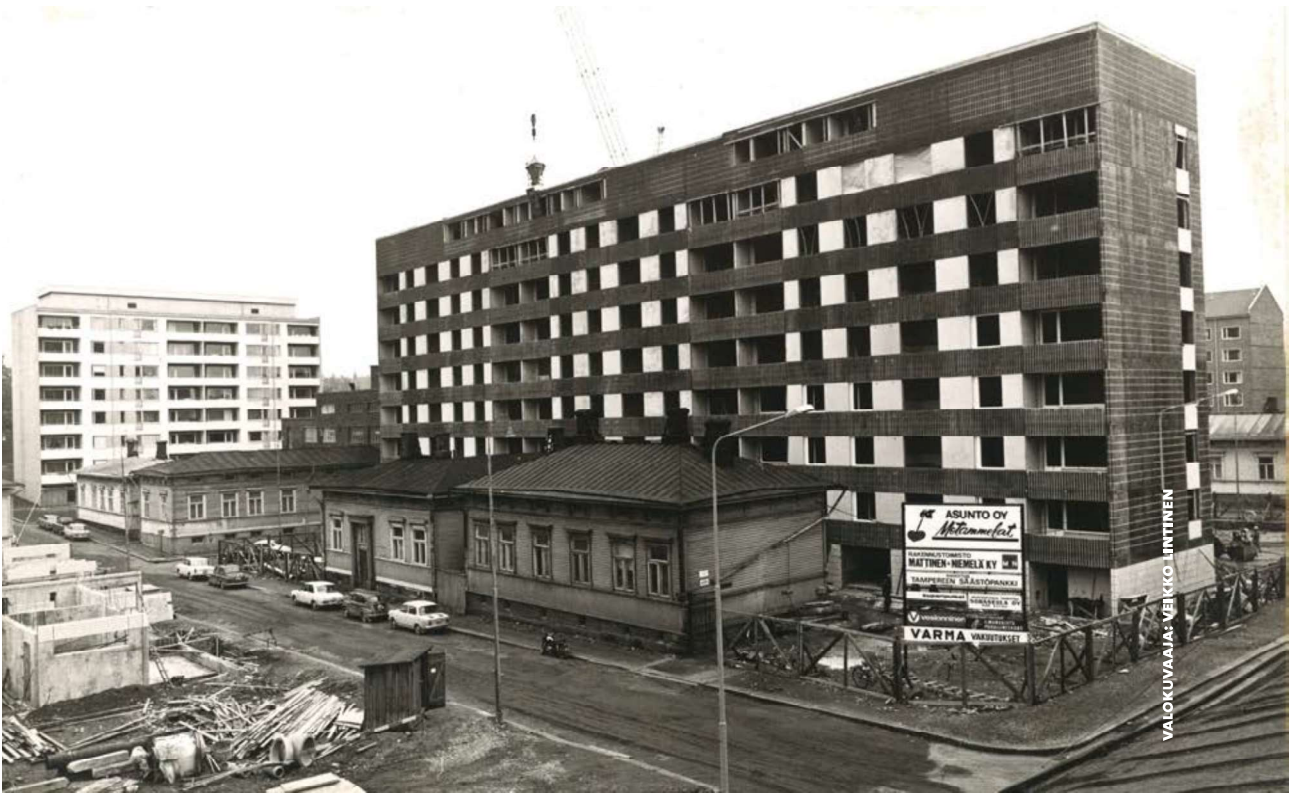
KUVA 2 Haastattelun virikkeenä käytetty valokuva Tammelan saneerauksesta vuodelta 1969. As. Oy Metammelät. Etualalla Kaivokatu. Sarja: 5-B. N:o 76.

Tammelan työväestön asuttamista puutaloista purettiin uusien elementtikerrostalojen tieltä (Kuva 2). Uudet kerrostalot suunniteltiin väljästi. Alueelle jäi näin paljon tilaa pienille nurmialueille ja parkkipaikoille. Paikallisyhteisö muuttui ja uusien asukkaiden elämä muodostui yksilö- ja perhekeskeiseksi kerrostaloasumiseksi (Koskinen & Savisaari 1971). Tammelan saneerauksen jälkeen alueen maisema muuttui hitaasti viime vuosiin asti. Tampereen asukasluvun lisääntyessä Tammelan merkitys kaupungin kehitykselle kasvoi, eikä sen tilankäyttö enää näyttäytynyt niin tehokkaana kuin 1970-luvulla (Wallin ym. 2018, 44).