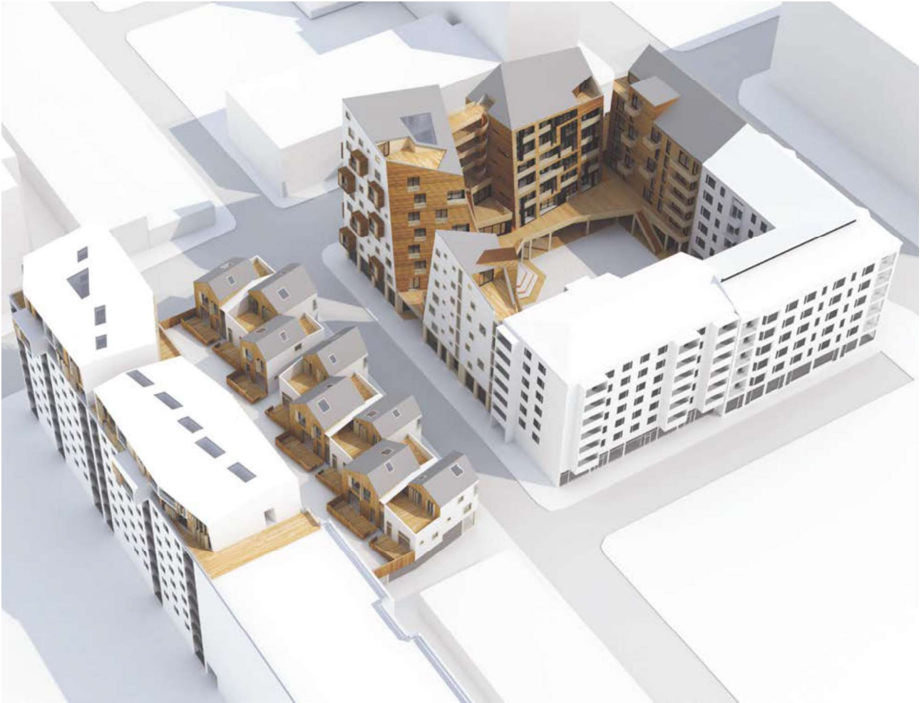
KUVA 4 Haastattelun virikkeenä käytetty arkkitehtipöytätyön näkemys Tammelan täydennysrakentamisesta, johon useimmat suhtautuivat myönteisesti.