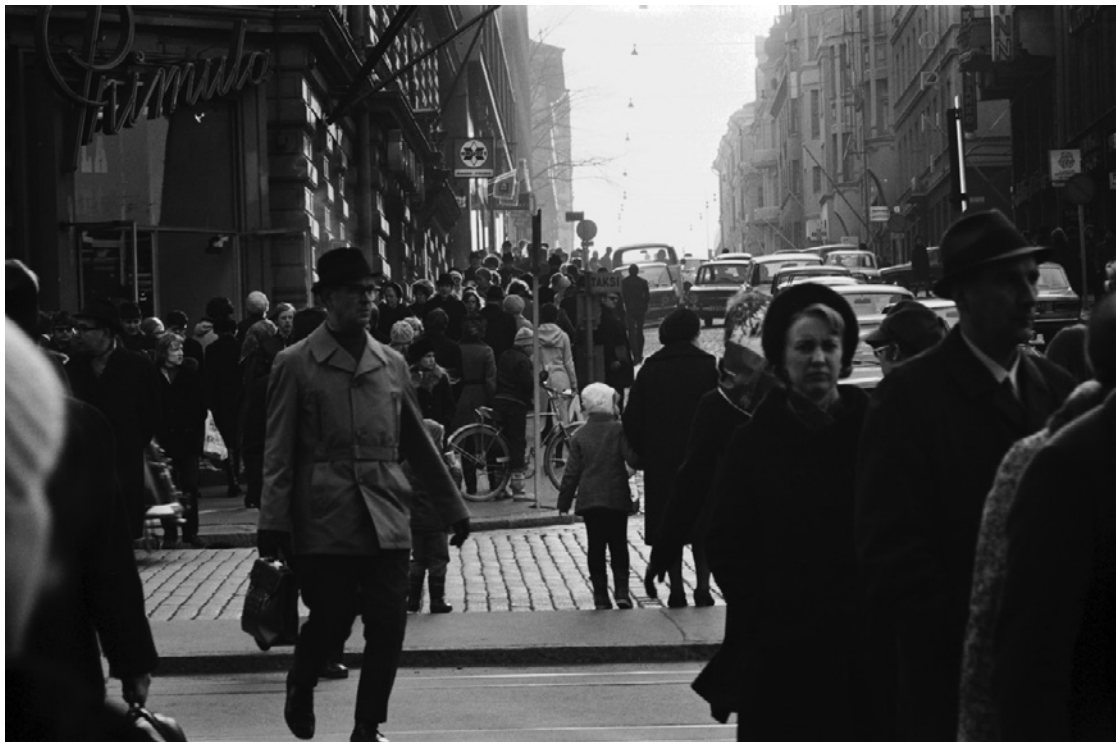
KUVA 1 Jalankulkijoita ruuhka-aikaan ns. Primulan kulmassa Mannerheimintien ja Kalevankadun risteyksessä.