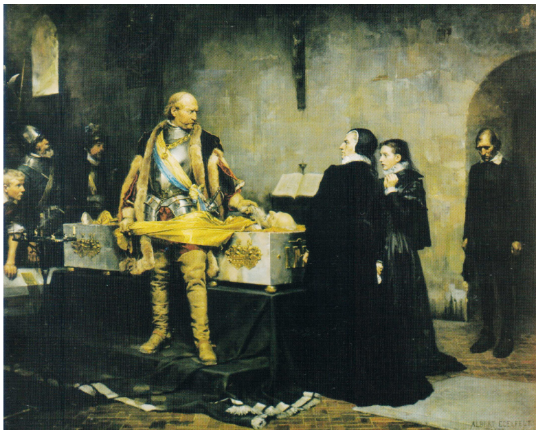
Fram till sin död var riksrådet Klas Fleming, befälningshavande i Finland, hertig Karls mest betydande motståndare i Finland. Konflikten kommer till uttryck i denna målning av Albert Edelfelt från år 1878, där hertig Karl skymfar Flemings lik.